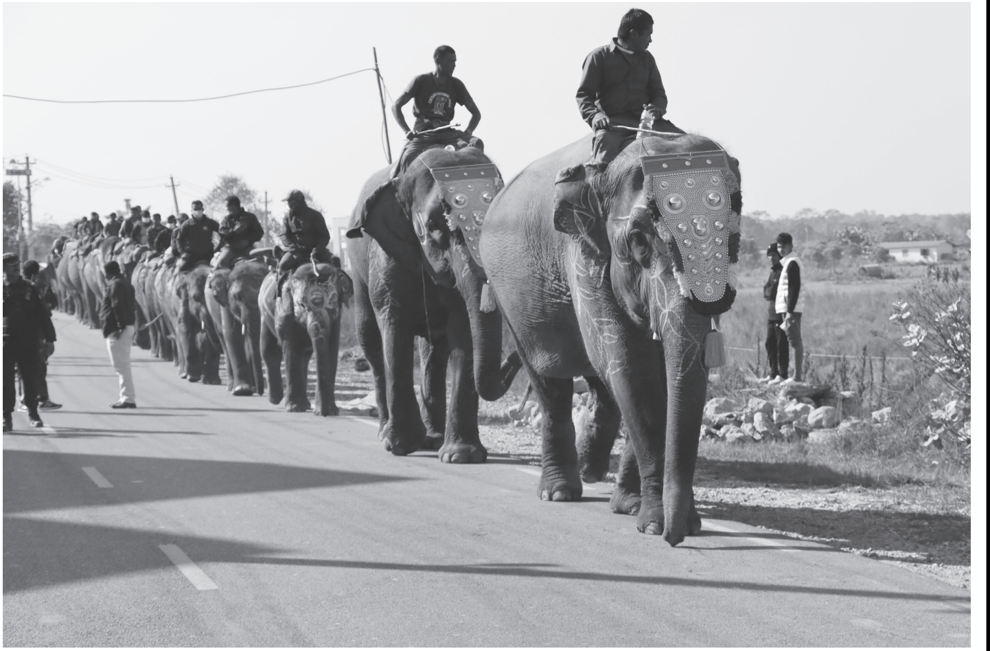
चितवनको सौराहामा मङ्गलबारदेखि सुरु १७ औं चितवन हात्ती तथा पर्यटन महोत्सवको शोभा यात्रामा हात्तीको लस्कर । क्षेत्रीय होटल संघ नेपाल चितवनको आयोजनामा सुरु महोत्सवमा हात्तीका विभिन्न गतिविधि हुनेछन् ।