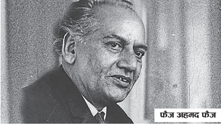
फैज अहमद फैज

‘मानवीय युद्धविराम’ हुँदा हमास र प्यालेस्टिनी पक्षले ११० इजरायलीलाई छोड्यो । त्यसको सट्टा इजरायलले २४० प्यालेस्टिनी महिला र