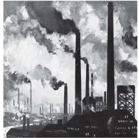
Adam Smith Wealth of Nations

चोरी व्यापार, ऋणको साँवाब्याज नतिर्ने प्रवृत्ति र चर्को ब्याजदर, व्यापार घाटा र अचाक्ली नाफा तथा आर्थिक विषमता बढ्दै गएका खबर सुन्दा कहिलेकाहीँ अर्थशास्त्रको कक्षामा सामेल भएर बढी भन्फट र चिन्ता लिनुपर्ने देखेर तिमीहरू तर्सनेछौ। साँचो कुरा त्यो होइन, बरु देशको मानवीय र प्राकृतिक स्रोतलाई नियालेर हेर्दा उज्ज्वल भविष्य वा भोलिको राम्रो नेपालको चित्र तिमीहरूले देख्नेछौ।