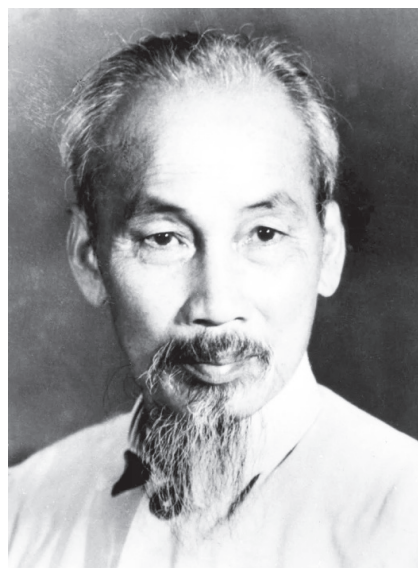
हो चि भिन्ह

तिमीहरूले पत्रमा पत्रकारिताको महत्त्वबारे पनि विद्यार्थीहरूमाझ छलफल भइरहेको कुरा उठाएका छौं।