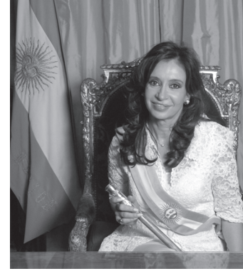
क्रिस्टिना फर्नान्डेज डे किर्चनर

केवल तीन वर्षमा एक विलक्षण उदारवादी अर्थशास्त्री र टीभी टक शोहरूमा नियमित सहभागी हाभियर मिलेइ एउटा राजनीतिक पार्टी बनाउन र अर्जेन्टिनाको राष्ट्रपति बन्न सफल भए। राष्ट्रपति निर्वाचनको दोस्रो चरणमा उनले आफ्ना पेरोनिस्ट (पेरोनवादी) प्रतिद्वन्द्वी सर्जियो मासालाई हराए। मासा चुनावको समयमा अर्थमन्त्री थिए, मतदानमा पूर्वअनुमान गरेको भन्दा धेरै ठुलो अन्तर (५४.७ प्रतिशत र ४४.३ प्रतिशत) ले मासा पराजित भए। मिलेइको जीत यति प्रशंसनीय रह्यो कि उनले पहिलो चरणमा आफ्नो प्रतिद्वन्द्वीले अग्रता लिएका ऐतिहासिक पेरोनिस्ट (पेरोनवादी) क्षेत्रहरूसहित २४ मध्ये २१ प्रान्तमा जीत हासिल गरे।