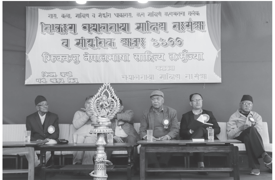
दसौं नेपाल भाषा साहित्य तःमुंज्या तथा सांस्कृतिक कार्यक्रम कीर्तिपुरका केही तस्बिरहरू।