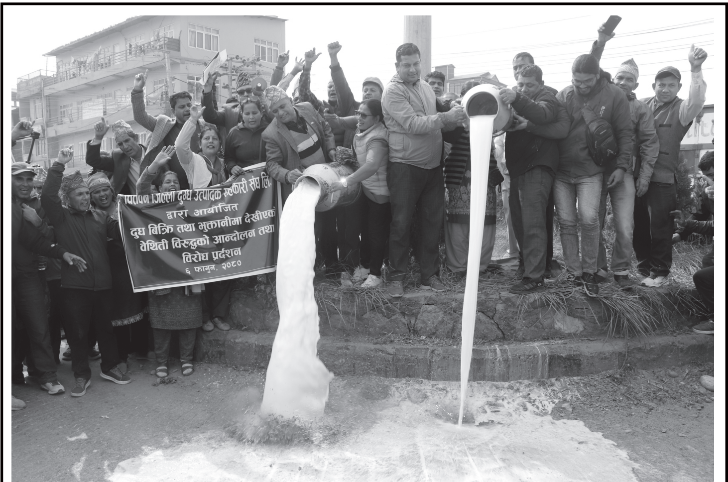
सडकमा दूध पोखेर विरोध प्रदर्शन गर्दै किसान : भरतपुरको केन्द्रीय बस टर्मिनल चोकस्थित सडकमा आइतबार दुग्ध उत्पादक सहकारीका किसानले दूध पोखेर विरोध प्रदर्शन गर्दै । लामो समयसम्म भुक्तानी नपाएको र जिल्लाबाट उत्पादित दूधको बजारीकरणमा समस्या भएको भन्दै सहकारीका किसानले सडकमा ८० लिटर दूध पोखेर विरोध जनाएका हुन् ।