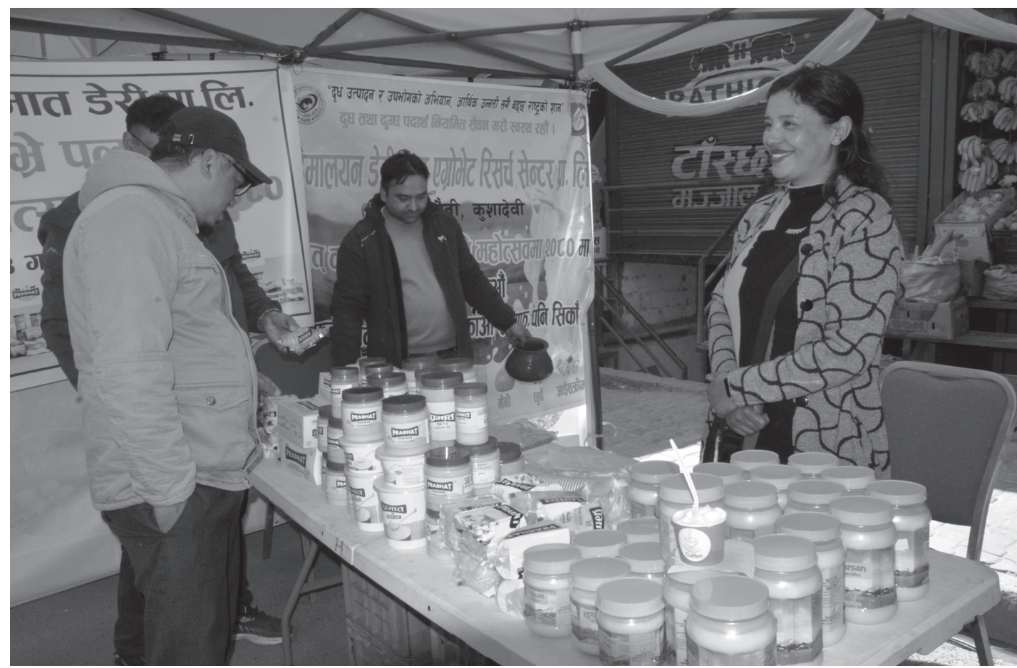
बिक्रीका लागि राखिएका घ्यू : जिल्ला समन्वय समिति काभ्रेपलाञ्चोकले बनेपामा आयोजना गरिएको 'बृहत् काभ्रेपलाञ्चोक कृषि महोत्सव-२०८०' मा बिक्रीका लागि राखिएका हिमालयन डेरी एन्ड एग्रोभेट रिसर्च सेन्टर प्रालि कुशादेवी पनौतीले उत्पादन गरेको घ्यू । शुक्रबारदेखि सुरु भएको महोत्सव फागुन ७ गतेसम्म चल्नेछ ।