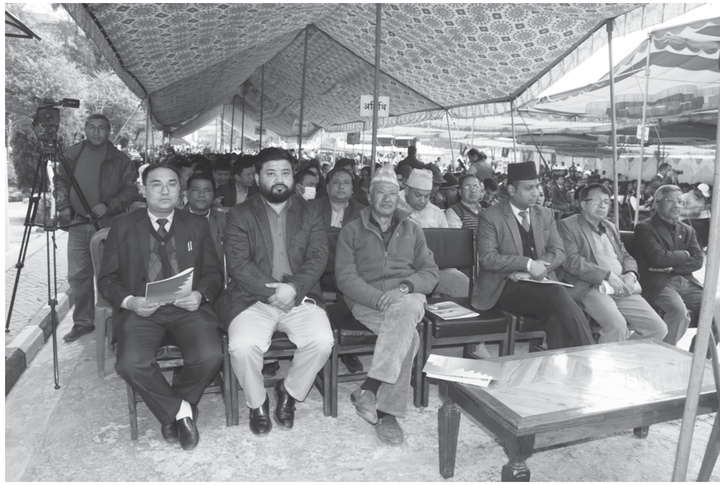
भक्तपुर नगरपालिकाद्वारा सञ्चालित बुधवार भएको ख्वप माध्यमिक विद्यालयको २४ औं, ख्वप कलेजको २२ औं, शारदा क्याम्पस माविको ३३ औं र ख्वप कलेज अफ लको प्रथम वार्षिकोत्सव कार्यक्रममा सहभागीहरू ।