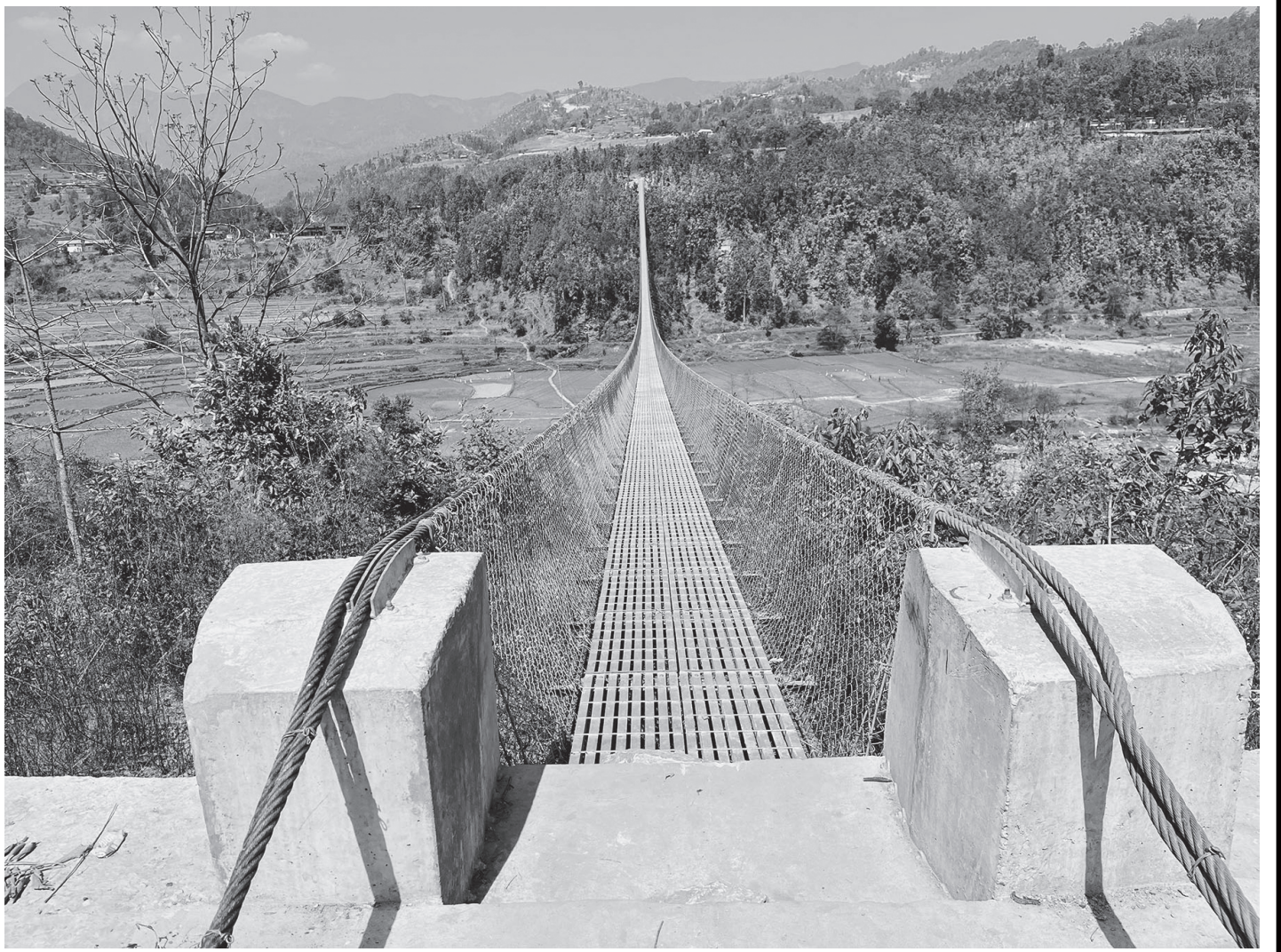
भोलुङ्गे पुलले घाटिएको पालिकाको दूरी