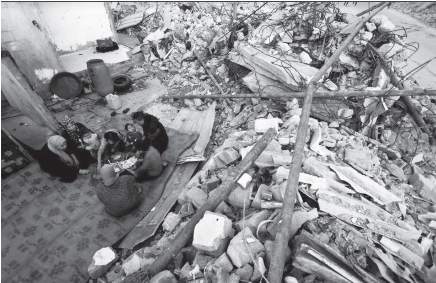
इजरायली बमबारी र खण्डहरबिच रमादान पर्व मनाउँदै दक्षिणी गाजास्थित रफा सहरको एक प्यालेस्टिनी परिवार। मार्च १३, २०२४। अक्टोबर ७ यता गाजामाथि इजरायलले गरेको फासीवादी हमलाका कारण मृत्यु हुने प्यालेस्टिनीहरूको सङ्ख्या ३१ हजार २ सय ७२ भन्दा बढी भएको गाजास्थित स्वास्थ्य मन्त्रालयले जनाएको छ।