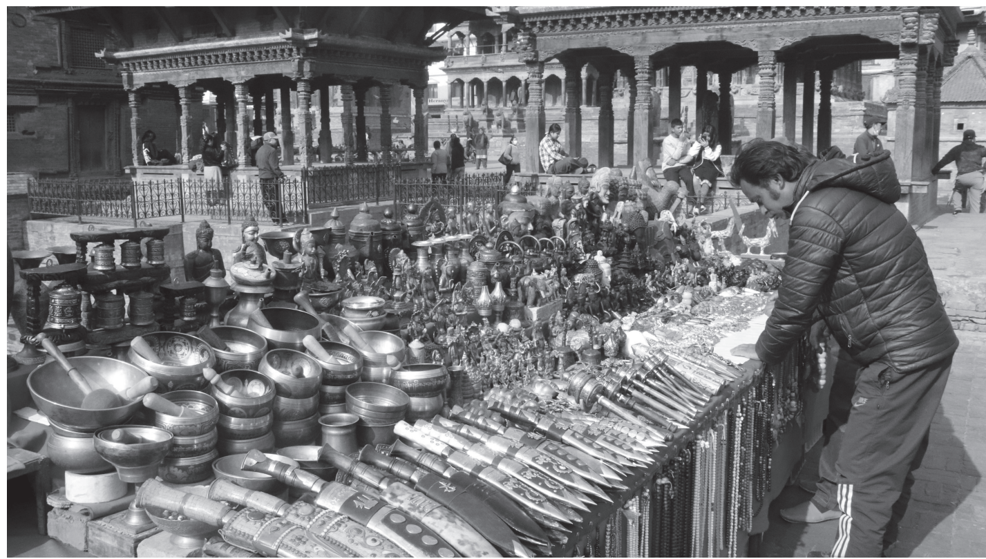
ललितपुर नगरपालिका-१२ स्थित पाटन दरवार क्षेत्र परिसरमा सोमबार बिहान बिक्रीका लागि राखेका सामग्री मिलाउँदै बिक्रेता।