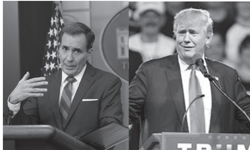
अमेरिकी राष्ट्रिय सुरक्षा प्रवक्ता जोन किर्बी (बायाँ) मस्को हमलामा युक्रेनको हात नभएको दाबी गर्दै र पूर्वराष्ट्रपति ट्रम्प (दायाँ) जसले ISIS को स्थापना पूर्वराष्ट्रपति बाराक ओबामाले गरिएको दाबी गर्छन्।

हमलाको पनि तयारी गरेको प्रस्ट हुन्छ। एउटा प्रतिवेदनको आधारमा हेर्ने हो भने विगत एक दशकदेखि त्यस्तो हमलाहरूको श्रृङ्खला रुसका विभिन्न सहर र स्थानहरूमा भएको देखिन्छ। सन् २०१६ मा दुई स्थान, २०१७ मा दुई स्थान, २०१८ मा दुई स्थान, सन् २०१९ मा एक स्थान