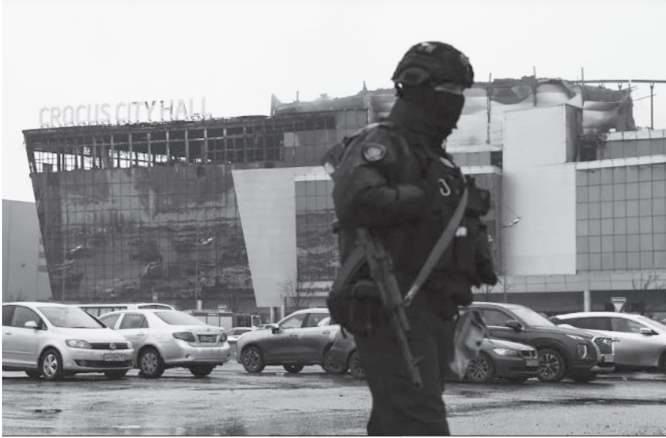
गत मार्च २२ मा हमला गरिएको मस्कोस्थित क्रकर्स सिटी हल

दुई शक्ति राष्ट्रबिचको आमनेसामने लडाईँको अवस्थालाई तार्न कुनै स्वार्थ समूह विशेषलाई उकास्दै हातहतियार र पैसा तथा तालिम नै दिएर एक शक्तिले अर्को शक्तिमाथि हावी हुन कुनै देशका दुई परस्परविरोधी राजनैतिक पक्षहरूबिचमा लडाईँ गराउने कार्य दोस्रो विश्वयुद्धको सङ्घारमै सुरु भइसकेको थियो। सन् १९३६ देखि १९३९ सम्म चलेको स्पेनको गृहयुद्ध यसको ज्वलन्त उदाहरण हो। दोस्रो विश्वयुद्धपछि भने तात्कालीन दुई महाशक्तिहरू अमेरिका र सोभियत सङ्घबिच सुरु भएको शीतयुद्धपश्चात् एक नयाँखाले लडाईँ देखापर्न