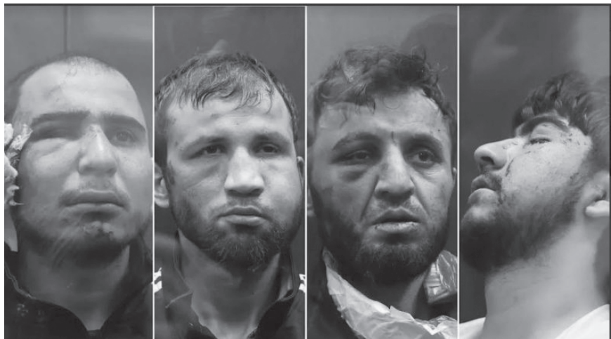
मस्को हमलामा संलग्न भनिएका ISIS-K खोसनिका चार आतङ्ककारीहरू।

थाल्यो। विशेषगरी सोभियत सङ्घको नयाँ शक्ति र उसको सहयोगमा तेस्रो विश्वका गरिब देशहरू उपनिवेशबाट मुक्त हुँदै गएपछि अमेरिकाको जासूसी संस्था सीआईएले यसलाई रोकन व्यवस्थितरूपमै नयाँ नीति अपनायो। समाजवाद स्थापना भएका देश र आफ्नो स्वार्थ भएका देशहरूमा आफ्ना कठपुतली सरकार स्थापना गर्न अमेरिकाले अनेक हठकण्डा अपनाउँदै जन निर्वाचित सरकारहरूलाई समेत सत्ताच्युत गर्ने घृणित, अनैतिक, अप्रजातान्त्रिक र गैरकानुनी युद्धहरू गर्ने नीतिको सुरुवात गर्यो। यस्तो युद्धलाई नै छद्मयुद्ध वा अड्ग्रेजीमा Covert