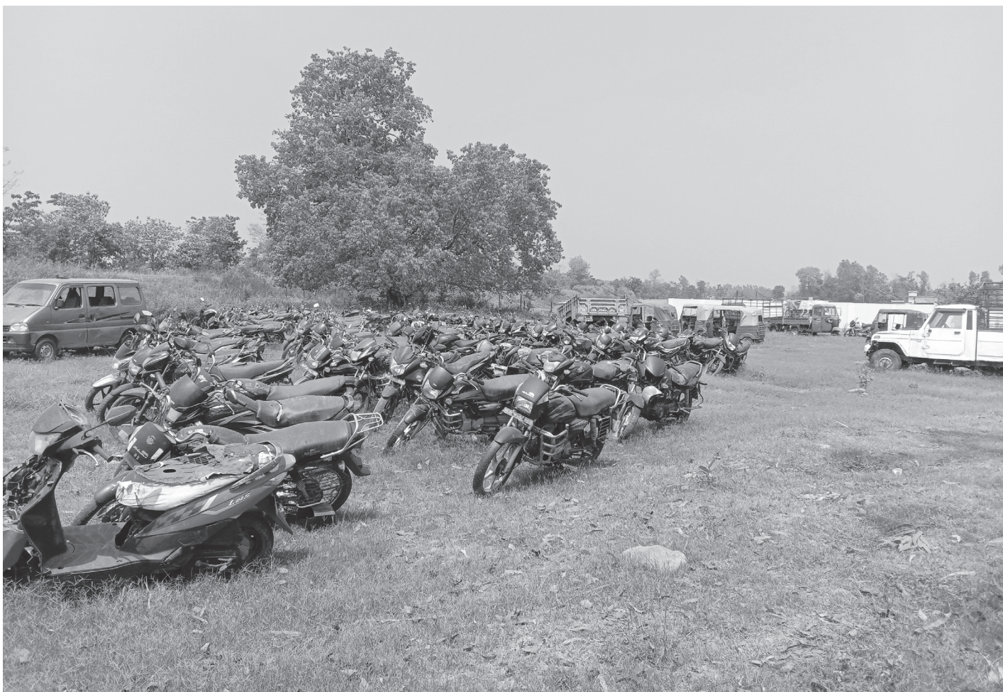
लिलाम हुन नसकेका सवारीसाधन

निवेदन परिसकेपछि कार्यालयले सम्बन्धित व्यक्तिलाई छलफलका क्रममा बोलाउने गरेको प्रहरी नायब निरीक्षक कार्कीले बताउनुभयो। छलफलमा सहमति भएर पीडितले आफ्नो रकम पाउने सुनिश्चित भएसँगै मिलापत्र हुने उहाँको भनाइ छ।