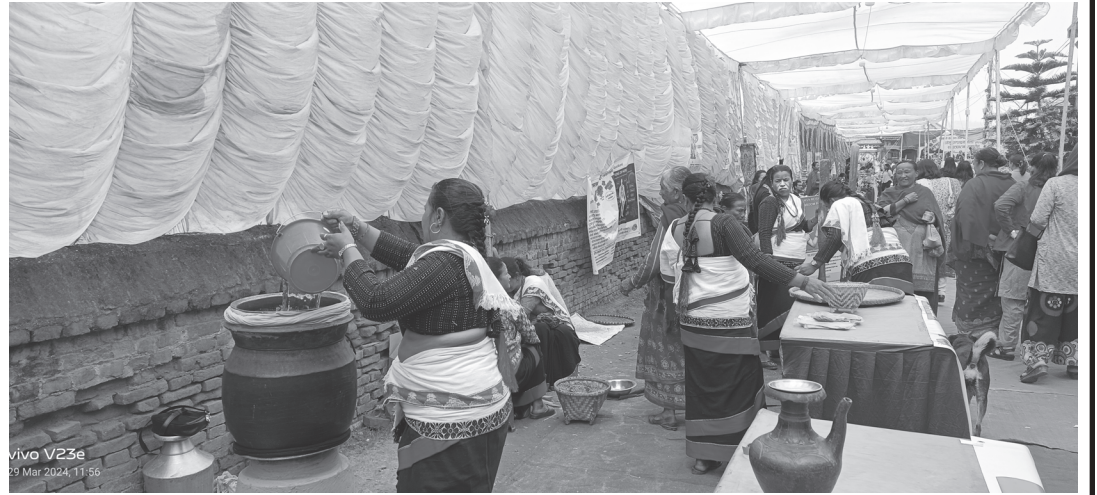
भक्तपुर घरेलु तथा साना उद्योग सङ्घको आयोजनामा भएको 'संस्कृति संरक्षण तथा पर्यटन प्रवर्द्धनका लागि घरेलु उत्पादन मेला'।