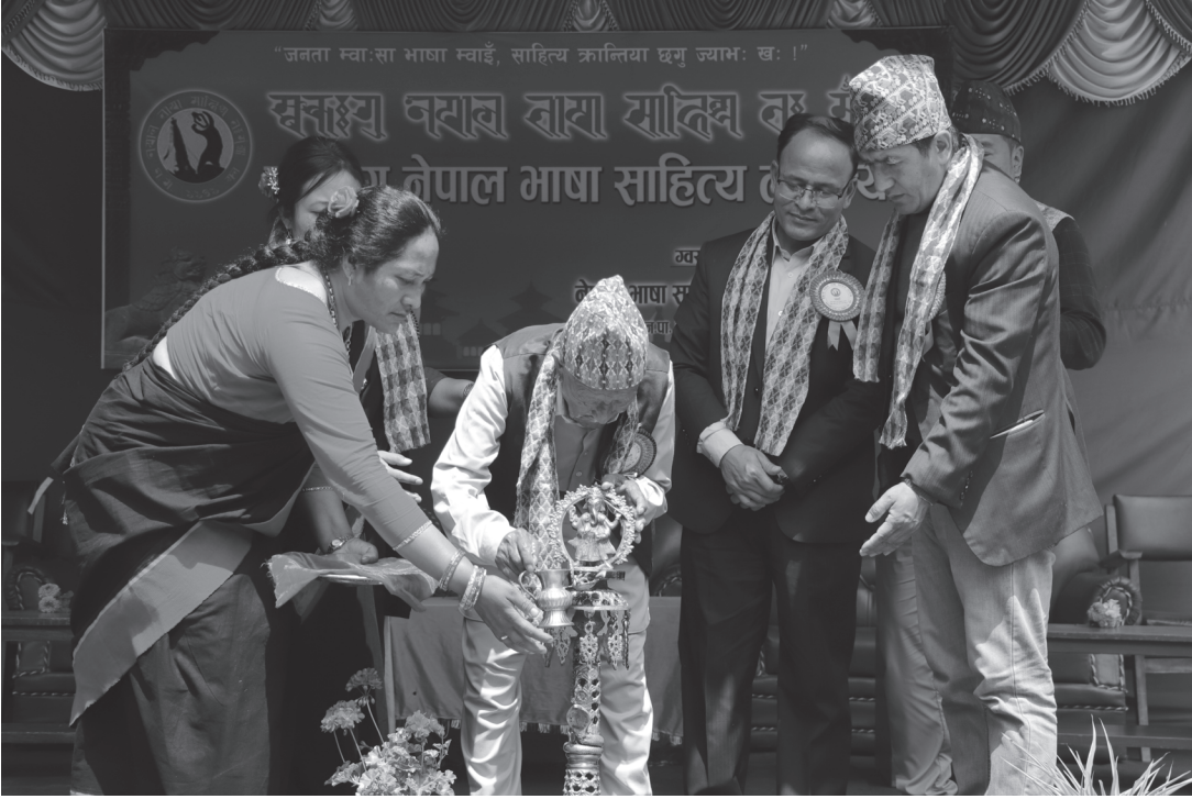
तेस्रो नेपालभाषा साहित्य त.मुञ्या ललितपुरको आयोजनामा महालक्ष्मी नागरपालिका देवनी टोल, थसीमा शनिबार भएको साहित्य त.मुञ्याको उदघाटन गर्दै स्थानीय ज्येष्ठ नागरिक र त.मुञ्यामा सहभागी स्रोताहरू तस्बिर : मजदुर दैनिक