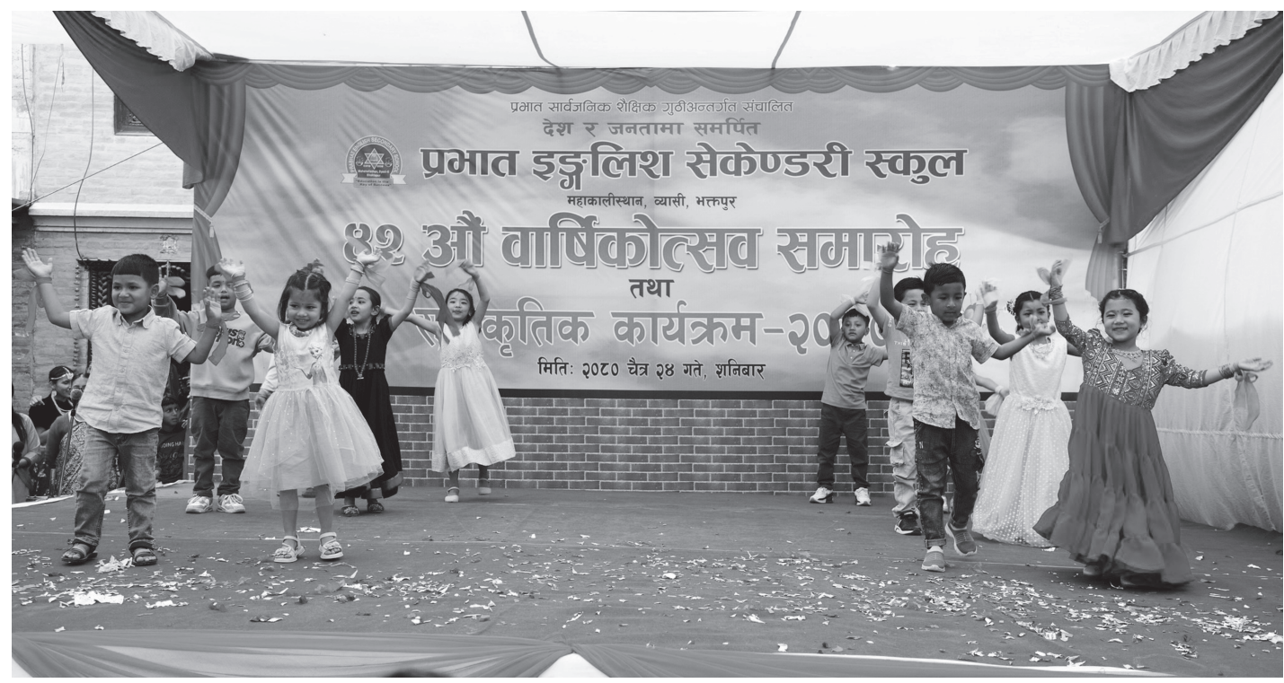
प्रभात इङ्ग्लिश सेकेण्डरी स्कूलको ४२ औं स्थापना दिवस अवसरमा शनिवार विद्यालयका बालबालिकारूद्रा प्रस्तुत नृत्य ।