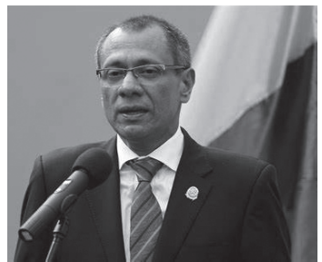
पूर्वउपराष्ट्रपति जर्ज ग्लास

ब्राजिल सरकारले कूटनीतिक मुख्यालयमा प्रहरी घुसपैठको 'कडा