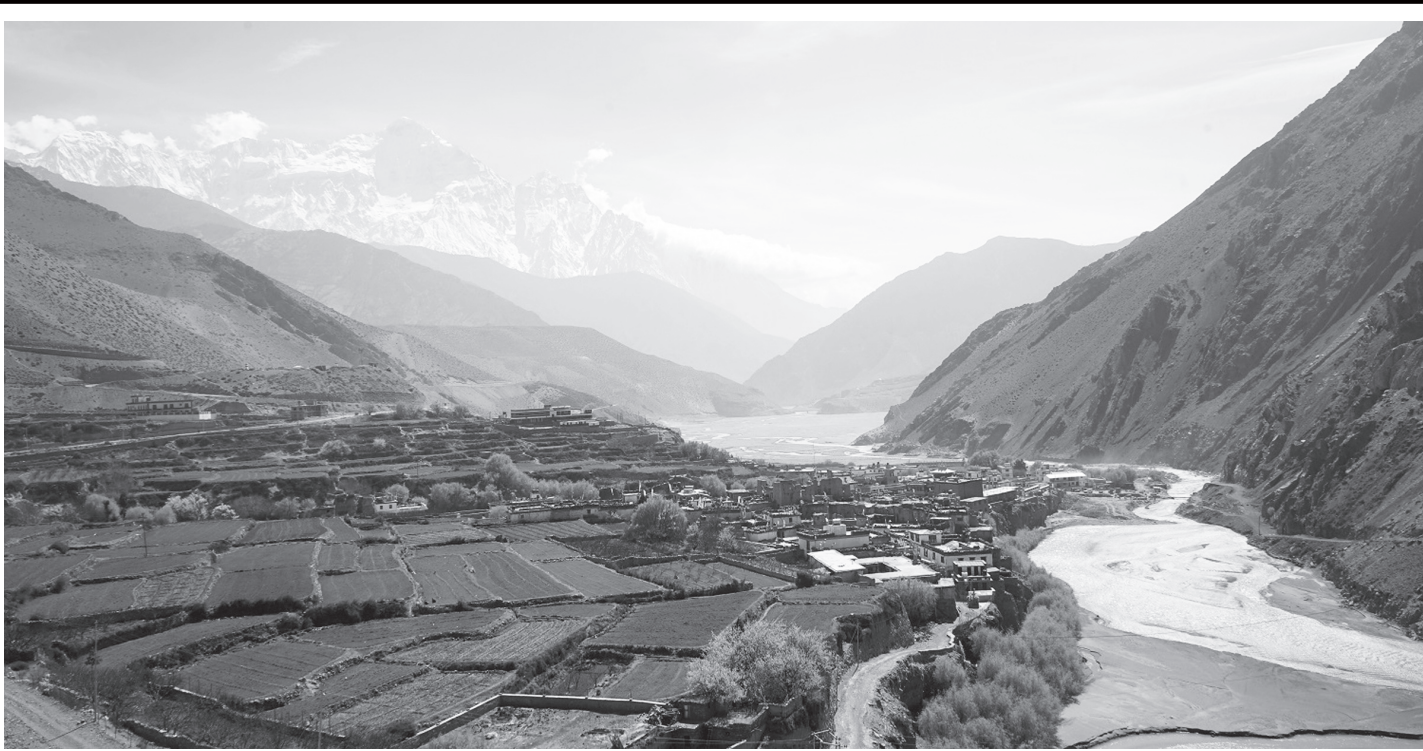
कागबेनी र निलगिरि हिमाल