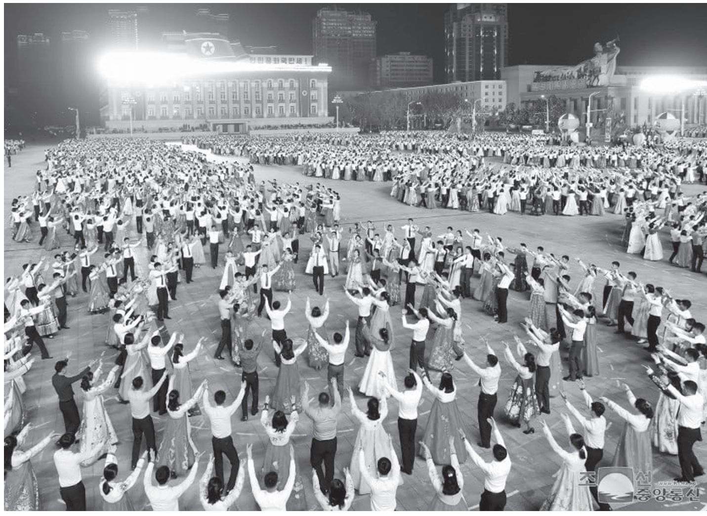
कोरियाली जनताका महान नेता किम इल सङको ११२ औं जन्म दिवस (सूर्य दिवस) को अवसरमा प्रजग कोरियाको राजधानी प्योङयाङको भिक्ट्री स्क्वायरमा आयोजित सामूहिक युगल नृत्य कार्यक्रममा सहभागी हजारौं युगल जोडीहरू अप्रिल १४, २०२४ को साँझ।