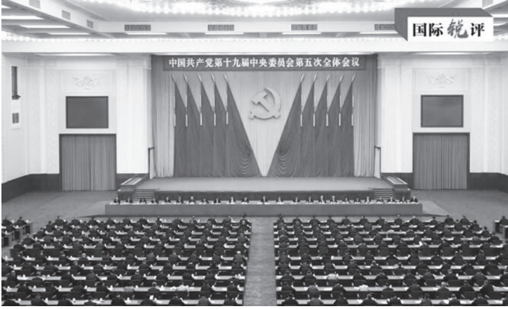
विश्वका ठुला परिवर्तनहरू द्रुत गतिमा महामारीले विश्वव्यापी आर्थिक र सामाजिक विकासमा गम्भीर प्रभाव पारेको छ। विश्वभरका सबै देशहरू पुनरुत्थानको नयाँ अवसरहरूको प्रतीक्षामा छन्। यस सन्दर्भमा, प्रमुख प्रस्थान बिन्दुहरूमा विश्वको दोस्रो ठुलो अर्थतन्त्रको विकास मार्गचित्र पक्कै पनि अन्तर्राष्ट्रिय समुदायको सामान्य अपेक्षा जगाउँदछ।

पेइचिङ, १५ अप्रिल (सीआरआई)। चिनियाँ कम्युनिस्ट पार्टीले देश चलाउन आर्थिक तथा सामाजिक विकासको मार्गनिर्देशन गर्न मध्यम र दीर्घकालीन योजनाको प्रयोग गर्नु महत्त्वपूर्ण तरिका भएकोमा जोड दिएको छ। यस पूर्ण बैठकको महत्त्वपूर्ण काम '१४ औं पञ्चवर्षीय योजना' अवधिमा चीनको विकासको दिशा अँल्याउनु हो। यो अवधि पहिलो ५ वर्षको हुनेछ जुन चीनले समाजवादी आधुनिक देश निर्माणको नयाँ यात्रालाई चौतर्फीरूपमा अग्रसर बनाउने छ र दोस्रो शताब्दी लक्ष्यको लागि अघि बढ्ने महत्त्वपूर्ण मार्ग तय गर्नेछ। अन्तर्राष्ट्रिय स्थितिबाट हेर्दा, हालको