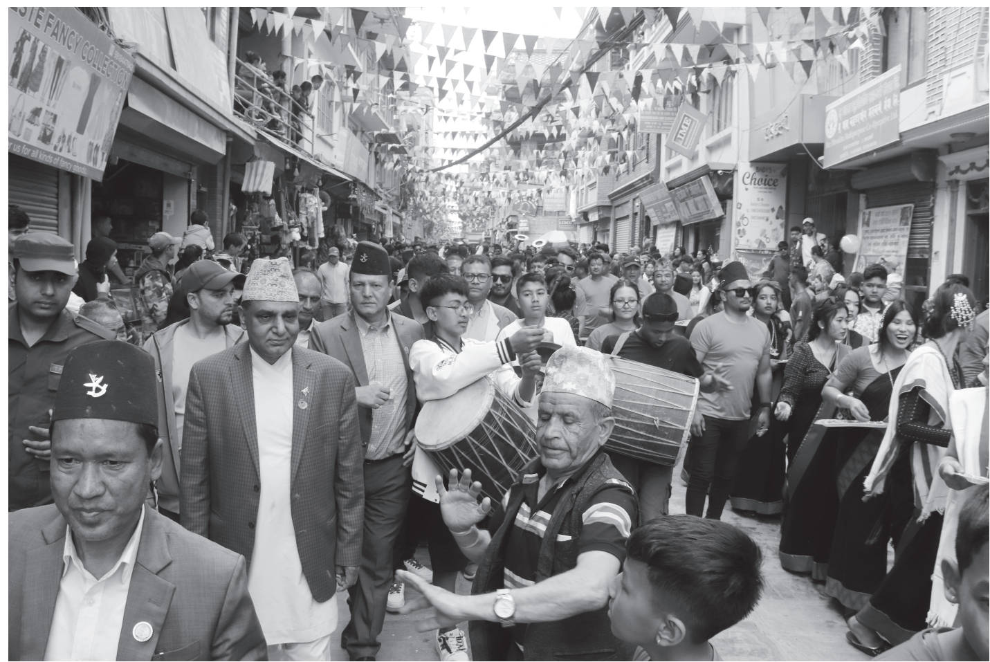
टोखा-बिस्का जात्रा :

काठमाडौंको ऐतिहासिक, धार्मिक र पुरातात्विक महत्त्व बोकेको टोखा बजारमा सोमबार बिस्का जात्रा मनाउँदै जात्रालु।