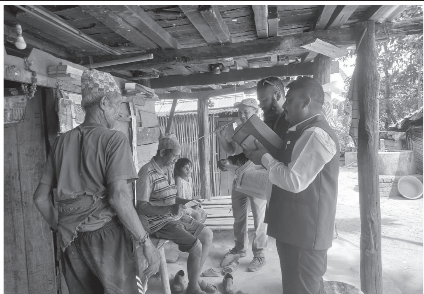
चुलाचुली गाउँपालिकाको मधुमल्ला वडा नं.६, नमुना चोक, राधाकृष्ण मन्दिर, वानेम चोक वडा नं १ लगायतका विभिन्न क्षेत्रमा नेमकिपाको घरदैलो कार्यक्रम सम्पन्न ।