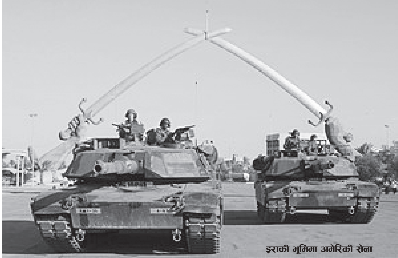
इराकी भूमिमा अमेरिकी सेना

रुसी विदेश मन्त्रालयका एकजना प्रवक्ताले एकपटक भनेका थिए, "संरा अमेरिका आफूलाई 'प्रजातन्त्रको प्रकाशस्तम्भ' का रूपमा देखाउनमा अभ्यस्त बनिसकेको छ। उसले सबैलाई उनीहरूले भन्ने गरेको 'शान्तिपूर्ण प्रदर्शन' प्रति मानवीय व्यवहार गर्न आग्रह गर्छ। तर, आफ्नै घरभित्र भने उसले ठीकविपरीत कदम चाल्ने गरेको छ।" उनले संरा अमेरिका 'प्रजातन्त्रको प्रकाशस्तम्भ' नभएको भन्दै अमेरिकी सरकारले केही राम्रा काम गर्न पहिला 'आफ्ना नागरिकमाथि दमनमा उत्रनु होइन, उनीहरूका कुरा राम्ररी सुन्नुपर्ने र अरु देशको मानवअधिकारको अवस्थाबारे पाखण्डपूर्वक बोल्न बन्द गर्नुपर्ने' बताइन्। "संरा अमेरिका अरु देशलाई मानवअधिकार र नागरिक स्वतन्त्रताको विषयमा उपदेश दिने स्थानमा छैन," उनले भनिन्।