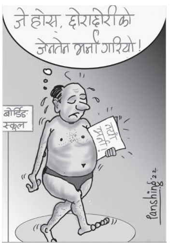
बाँकी पृष्ठ ८ मा