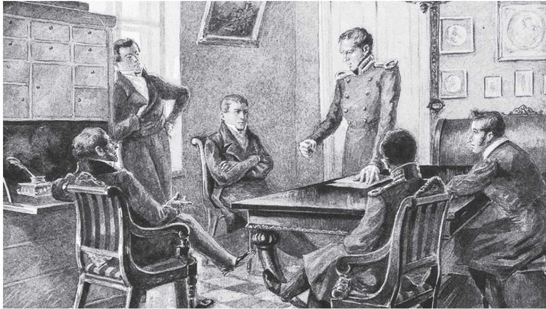
गुप्त समाजको बैठक