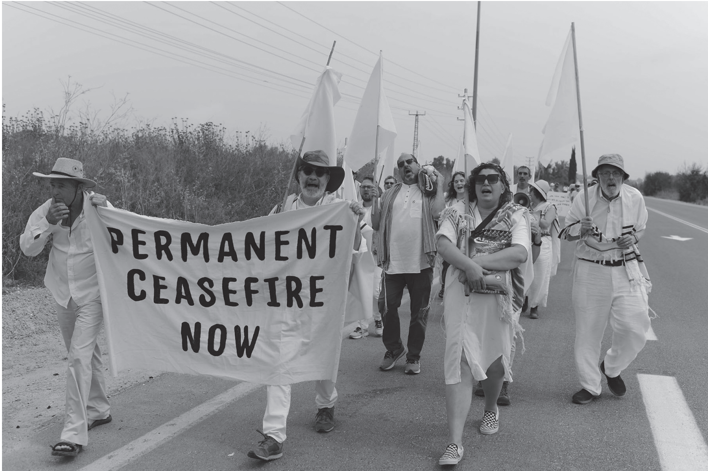
अप्रिल २६, २०२४ का दिन इजरायलको उत्तरी गाजापट्टीको सिमानामा रहेको गाजापट्टीमा स्थायी युद्धविरामको लागि आह्वान गर्दै मानिसहरू इरेज क्रसिडतर्फ अघि बढ्दै। इस्लामिक प्रतिरोध आन्दोलन (हमास) ले शुक्रबार कुनै पनि विचार वा विचारका लागि खुलापन घोषणा गरेको छ। जारी इजरायली आक्रमणबाट गाजापट्टीमा प्यालेस्टिनीको मृत्यु हुने सङ्ख्या ३२३५६ पुगेको हमासद्वारा सञ्चालित स्वास्थ्य मन्त्रालयले शुक्रबार भनेको छ।