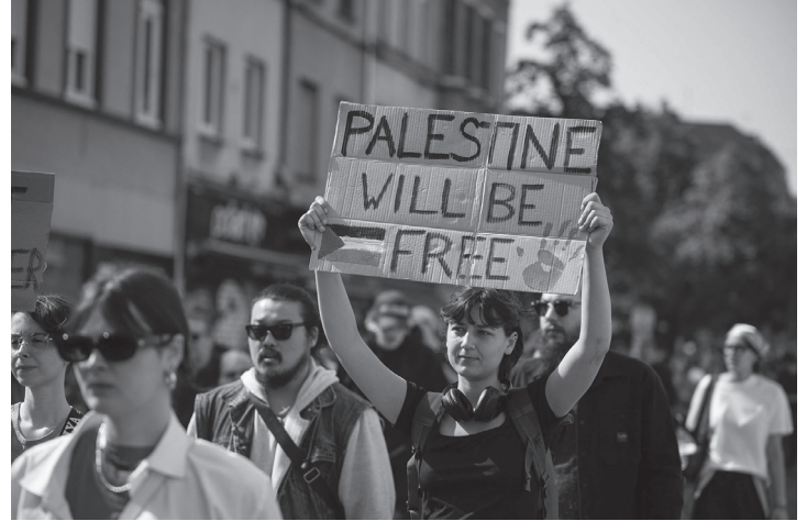
फ्रान्सको राजधानी पेरिस