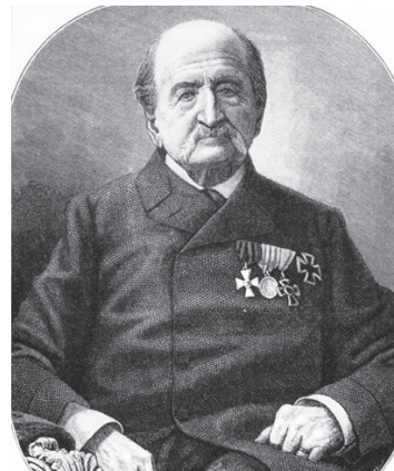
क्रमशः सेर्गेइ, इस्पोलित र मात्भेइ मुराभ्योम अपोस्तोल

राजपरिषद् सदस्य (सिनेटर) थिए। विद्रोहको बेला पनि उनी सिनेटर नै थिए। डिसेम्बर विद्रोहपछि फाँसी दिइएका पाँचजना युवाहरूमध्ये सेर्गेइ मुराभ्योम-अपोस्तोल एक थिए। मात्भेइ र सेर्गेइका भाइ इस्पोलित १९ वर्षको कलिलो उमेरमा दक्षिणको विद्रोहमा मरेका थिए। मात्भेइ,