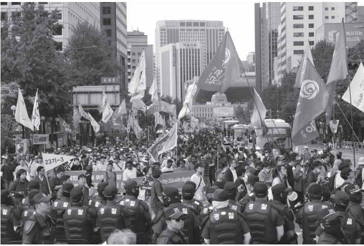
दक्षिण कोरियाको सिउल