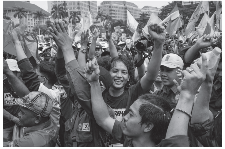
इन्डोनेसियाको राजधानी जाकर्ता