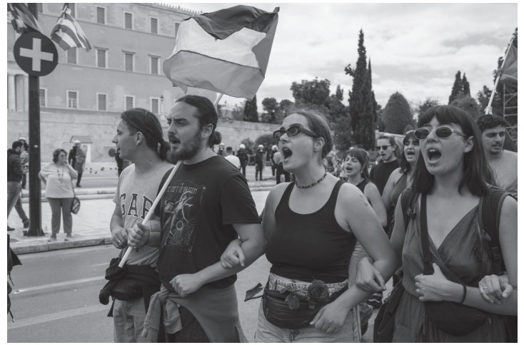
ग्रीसको राजधानी एथेन्स