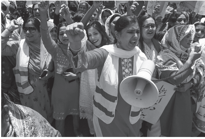
बङ्गलादेशको राजधानी ढाका