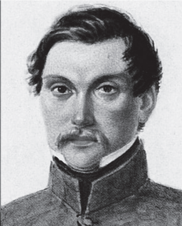
पुश्किन र पुश्किन

खानदानी परिवारमा पुश्किनको जन्म भयो । उनका बुबा सेनामा मेजर थिए । आमा एक रूसी जर्नेलकी छोरी थिइन् । प्रारम्भिक शिक्षाको निमित्त पुश्किनलाई घरमै फ्रान्सेली शिक्षकहरूको व्यवस्था गरिएको थियो । दस वर्षको उमेरसम्म उनले फ्रान्सेलीबाहेक अरू भाषा बोलेनन् । उनको हेरविचार एक शिक्षित र साहित्यमा रूचि राख्ने धार्मिक आमाको थियो । पछि उनैबाट पुश्किनले रूसी भाषा सिकेका थिए ।