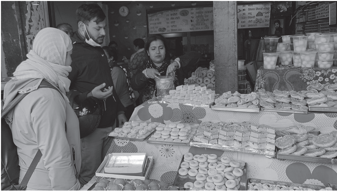
मिठाइ किन्दै सर्वसाधारण

मातातीर्थ औंसी आमाको मुख हेर्ने दिन भक्तपुर सल्लाघारीस्थित मिठाइ पसलमा मिठाइ किन्दै सर्वसाधारण ।