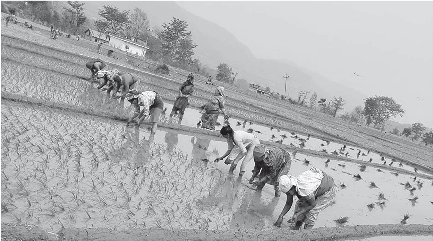
चैते धान रोप्दै किसान

विनम्र निर्माण सेवा सुर्खेतले रु. ५५ लाख चार हजार सात सय ७५ मा सडक विस्तारको ठेक्का लिएको छ । २०८१ असार मसान्तसम्म निर्माण सम्पन्न गर्नुपर्ने ठेक्का सम्झौतामा उल्लेख छ । पर्यटकीय मार्गको विस्तारको काम धमाधम भइरहेको छ । तीन किलोमिटर लम्बाइ रहेको उक्त पर्यटकीय सडकमा १.५ किलोमिटर दूरी चार मिटर चौडाइको ग्राभेल र चार सय ५० घनमिटर ग्याबिन जाली र २.५ किलोमिटर सडक चौडा पारिने सडक डिभिजन कार्यालय जुम्लाले जनाएको छ । रारा पर्यटकीय मार्गको विस्तारको काम सम्पन्न भएमा गमगढीवासीका साथै कर्णाली करिडोर र कर्णाली राजमार्ग हुँदै मुगु जिल्ला सदरमुकाम गमगढी आउने आन्तरिक तथा बाह्य पर्यटकलाई राराताल पुग्न १० मिनेट मात्र लाग्ने छ । रासस