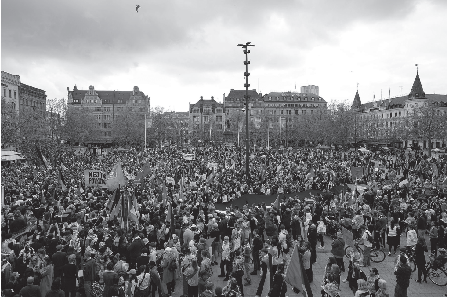
युरोपेली राष्ट्र स्वीडेनको माल्मो सहरमा गाजामा इजरायलद्वारा भइरहेको हमला र नरसंहार बन्द हुनुपर्ने माग गर्दै प्यालेस्टिन समर्थक प्रदर्शनकारीहरू विरोध प्रदर्शन गर्दै शनिवार, मे ११, २०२४ का दिन । प्रदर्शनकारीहरूले युरोभिजन गीत प्रतियोगिताको फाइनलअधि इजरायली प्रतियोगी इडेन गोलानको सहभागिताको समेत विरोध गर्दै उनलाई प्रतियोगिताबाट निष्कासन गर्नुपर्ने माग गरिरहेका छन् ।

अध्ययन गोष्ठीमा ‘रुसको डिसेम्बर विद्रोह (जारविरुद्ध पड्यन्त्र)’ पुस्तकबारे चर्चा गरिएको थियो ।