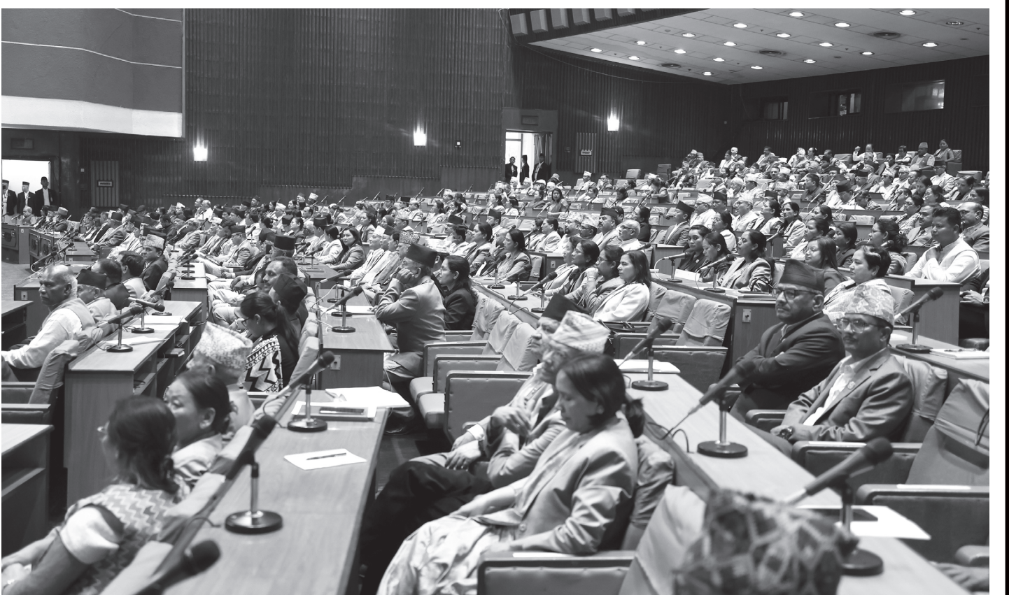
सङ्घीय संसद्को दुवै सदनको संयुक्त बैठक