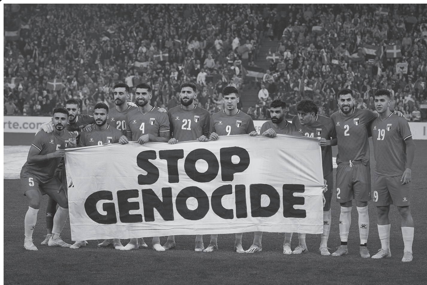
स्पेनको बाबियो सहरमा स्पेनको बास्क कन्ट्रीको फुटबल टिमसित मित्रवत् खेल खेल्नुअघि गाजामा इजरायली आक्रमण र नरसंहारको विरोधमा 'नरसंहार बन्द गर' लेखिएको ब्यानर प्रदर्शन गर्दै प्यालेस्टिनी खेलाडीहरू नोभेम्बर १५, २०२५ का दिन।