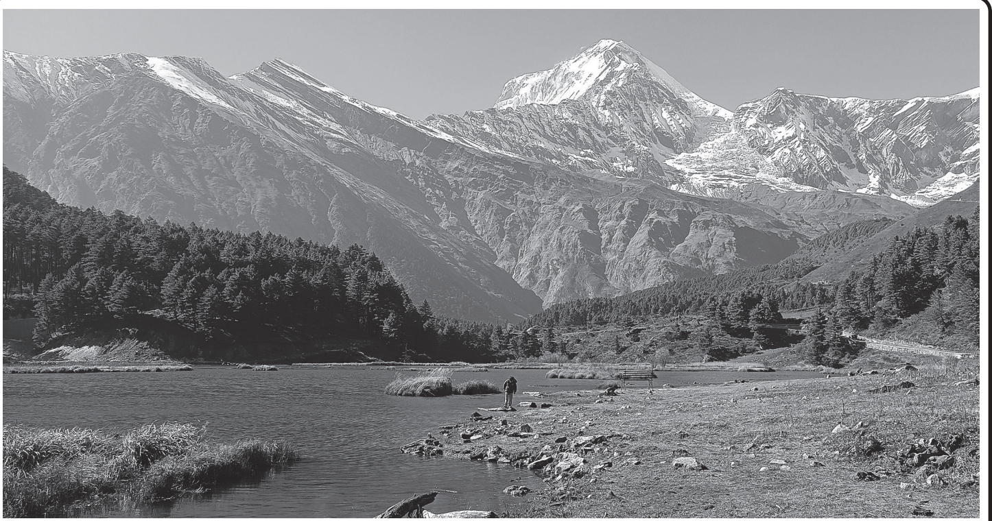
टिटी ताल र धौलागिरि हिमाल

यही कार्तिक २६ देखि २८ गतेसम्म भारतको नयाँ दिल्लीमा सञ्चालित सो बैठकमा गत मङ्सिरमा काठमाडौंमा सम्पन्न आठौं समन्वयात्मक बैठकबाट पारित एजेण्डा कार्यान्वयनको विषयमा समीक्षा भएको थियो । बैठकबाट पारित साभ्या धारणालाई प्रभावकारिरूपमा कार्यान्वयन गर्ने र आगामी रणनीतिक विषयमा समेत छलफल भएको थियो । रासस