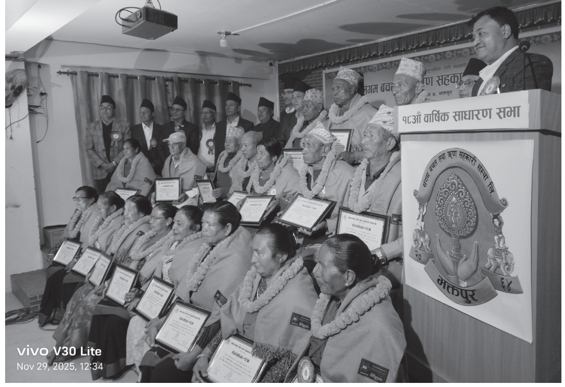
vivo V30 Lite Nov 29, 2025, 12:34

भक्तपुर, १३ मङ्सिर। संगम बचत तथा ऋण सहकारी संस्थाको अठारौं साधारणसभा शनिबार सम्पन्न भयो।