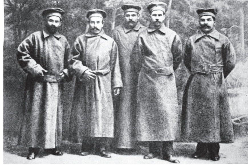
चौथो राज्य ड्युमामा बोल्शेभिकहरू (बायाँबाट क्रमशः) : पेत्रोभ्स्की, मुरानोभ, बादायेभ, सामोइलोभ र शागोभ। ('६ बोल्शेभिक' मध्ये यो तस्विरमा घुसपैठिया मालिनोभ्स्की छैनन्।)

क्राको सम्मेलनका निर्णय र प्रस्तावहरू सबै कलकारखानाका मजदुरले अध्ययन गरे। हाम्रो