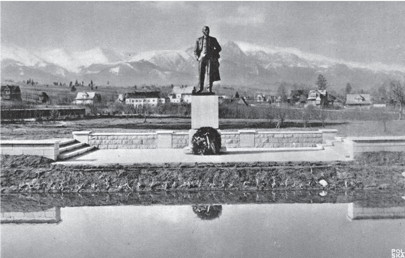
लेनिन भूमिगत बस्नुभएको पोल्यान्डको पोरोनिनोमा लेनिनको सालिक

जिल्ला कार्यकारी आयोगहरूले सेन्ट पिटर्सबर्ग समितिमा प्रतिनिधि पठाउँछन्। यहाँ पनि जिल्ला समितिका सबैलाई यो आयोगबारे थाहा हुँदैन। सेन्ट पिटर्सबर्ग समितिले समेत एउटा तीन सदस्यीय कार्यकारी आयोग निर्वाचित गर्छ। कहिलेकाहीँ कुरा गोप्य राख्न प्रतिनिधिलाई जिल्ला आयोगले छुनोट गर्नु सही हुँदैनथ्यो। यस्तो बेला यसको जिम्मा सेन्ट पिटर्सबर्ग समितिलाई