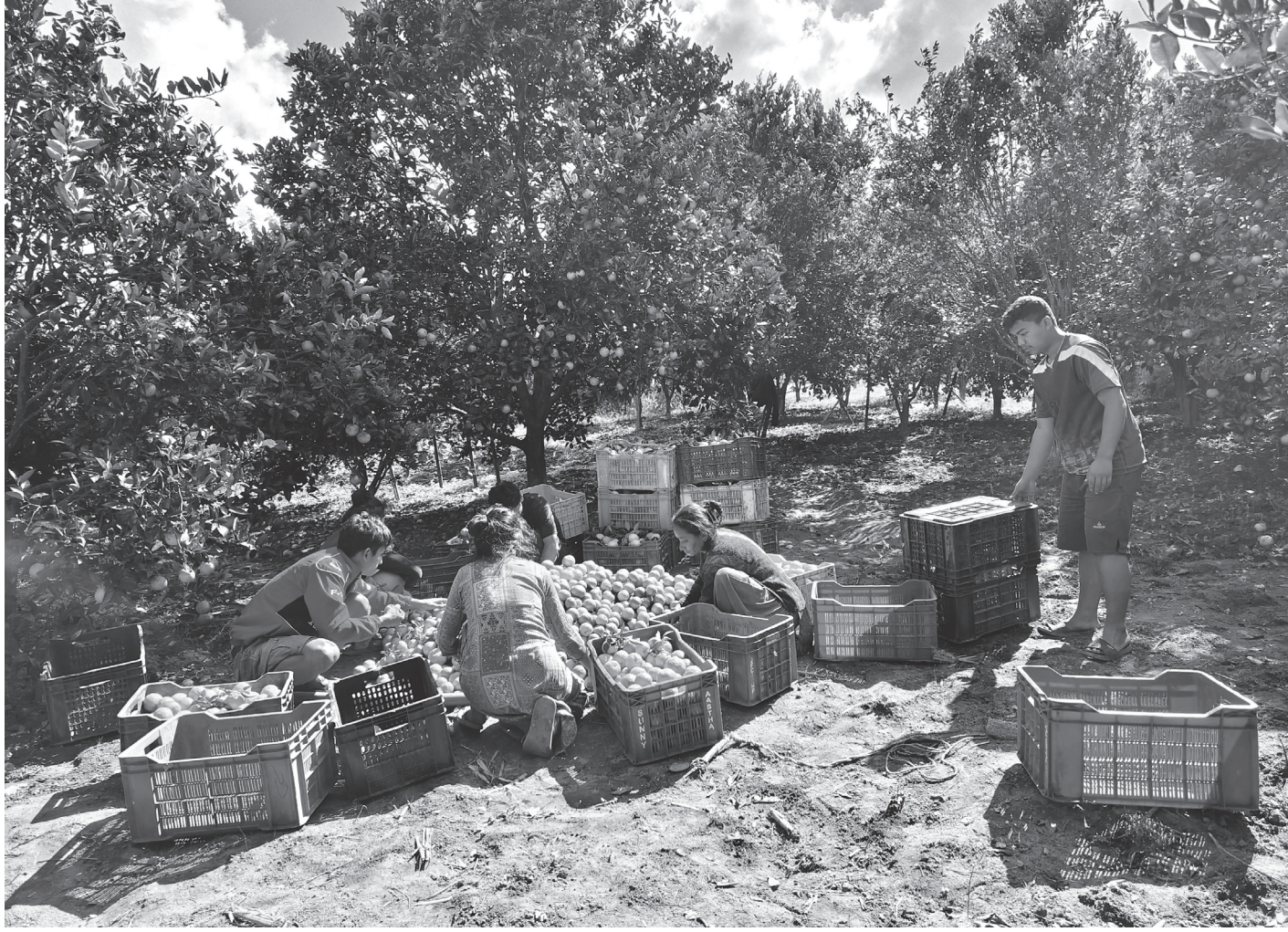
सिन्धुलीको जुनार : सिन्धुलीको गोलञ्जोर गाउँपालिका-४ माभक्तपुरको किसान बगैँचामा रहेको जुनार टिपेर ब्रिकीका लागि बजार पठाउने तयारी गर्दै । सिन्धुली जुनारखेतीका लागि प्रख्यात छ ।