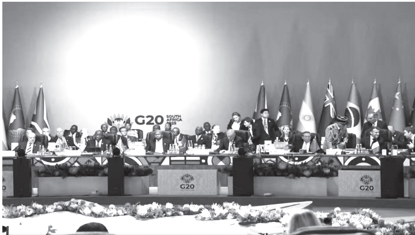
स्थानीय समयअनुसार नोभेम्बर २२ मा दक्षिण अफ्रिकी राष्ट्रपति सिरिल रामाफोसाले २० औं जी-२० नेताको शिखर सम्मेलन। शिखर सम्मेलनले पारित गरेको घोषणापत्रमा जलवायु कार्य, ऋण मुद्रा, समावेशी वृद्धि र बहुपक्षीय सहयोगजस्ता मुख्य बुँदाहरू समावेश छन्।