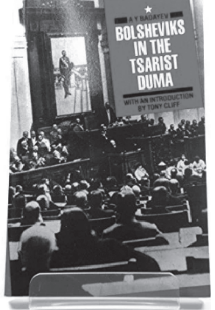
मजदुर अगुवाहरूलाई प्रायः सेन्ट पिटर्सबर्गबाहिर पठाइन्थ्यो। उनीहरूलाई सरकारले तोकैका ५२ विशेष बस्तीहरूमा प्रवेश गर्न मनाही थियो। कारखाना प्रशासनले मजदुरहरूलाई निजी पत्र लेख्ने र तिनलाई 'पुरानै सर्तमा' काममा फर्कन निम्तो दिन्थ्यो। तैपनि, मजदुरहरू सङ्घर्षमा डटिरहे।