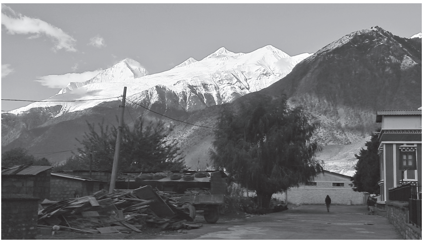
धौलागिरि हिमाल र आसपासका हिमशृङ्खला :