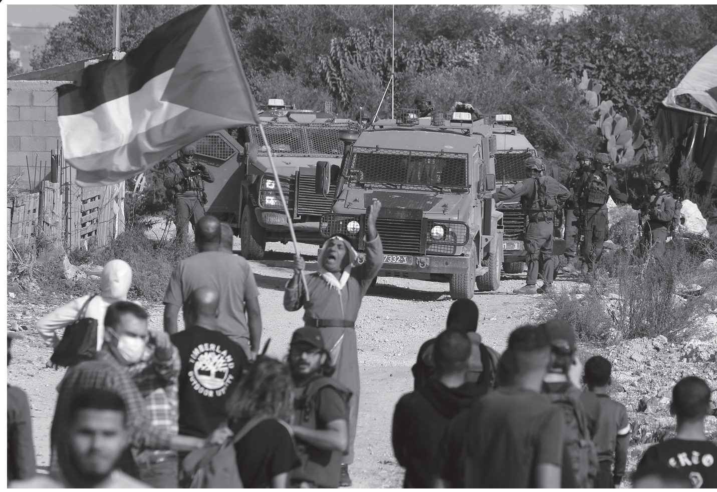
उत्तरपश्चिम प्यालेस्टिनको तुल्कराम सहरको पूर्वी भागमा अवस्थित नुर शाम्म विस्थापित शिविरअगाडि आफ्नो घर फिर्ता जान पाउनुपर्ने माग राखी प्रदर्शनरत प्यालेस्टिनीहरू र बाटो रोकेर बसेका इजरायली सेना नोभेम्बर २३, २०२५ का दिन। इजरायलले गरिरहेको यहूदी बस्ती विस्तारका कारण प्यालेस्टिनीहरू आफ्नो घर र गाउँबाट विस्थापित भइरहेका हुन्।