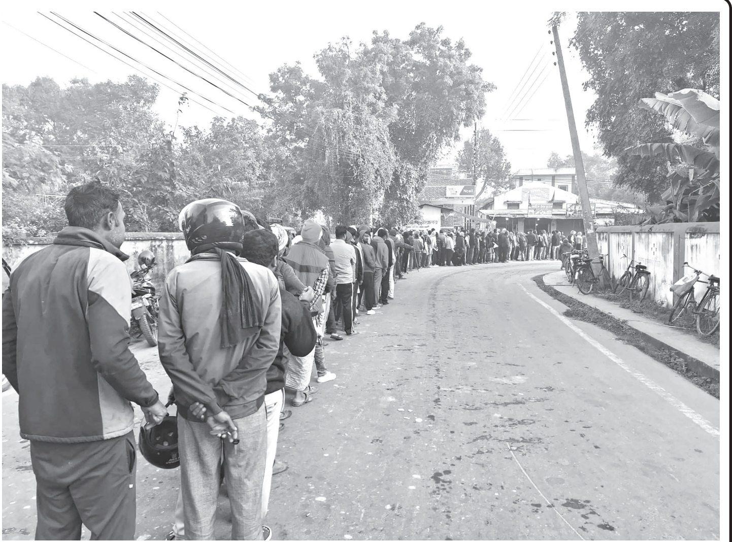
रासायनिक मल किन्न लामबद्ध किसान