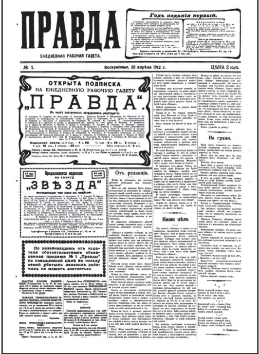
सन् १९१२ को मे महिनामा प्रकाशित 'प्राभ्दा' (सत्य) पत्रिकाको पहिलो अङ्क।

नगडिसकेका सबैलाई आफूतिर तान्दै मेन्शेभिकहरूसँग भिड्ने अभिभारा हाम्रो थियो। यी यावत् विषयमा विचार गरेपछि पोरानिनो सम्मेलनबाट '७ मेन्शेभिकहरू' लाई चेतावनी दिन केही कदम लिन आवश्यक थियो। यसको लागि समूहका दुवै खेमालाई बराबरी अधिकारको माग राख्नुपर्ने तय भयो। यो मागलाई अस्वीकार गरेपछि '७ मेन्शेभिक' सँग छुट्टिएर अलग्गै समूह बनाउने योजना बन्यो। यसलाई सम्मेलनको दस्तावेजमा यसरी उल्लेख गरियो: "सामाजिक जनवादी संसदीय समूहको एकता सम्भव र आवश्यक रहेको यो सम्मेलनको ठहर छ। तर, '७ मेन्शेभिकहरू' को रवैयाले यो एकतालाई खतरामा पार्दै छ।"