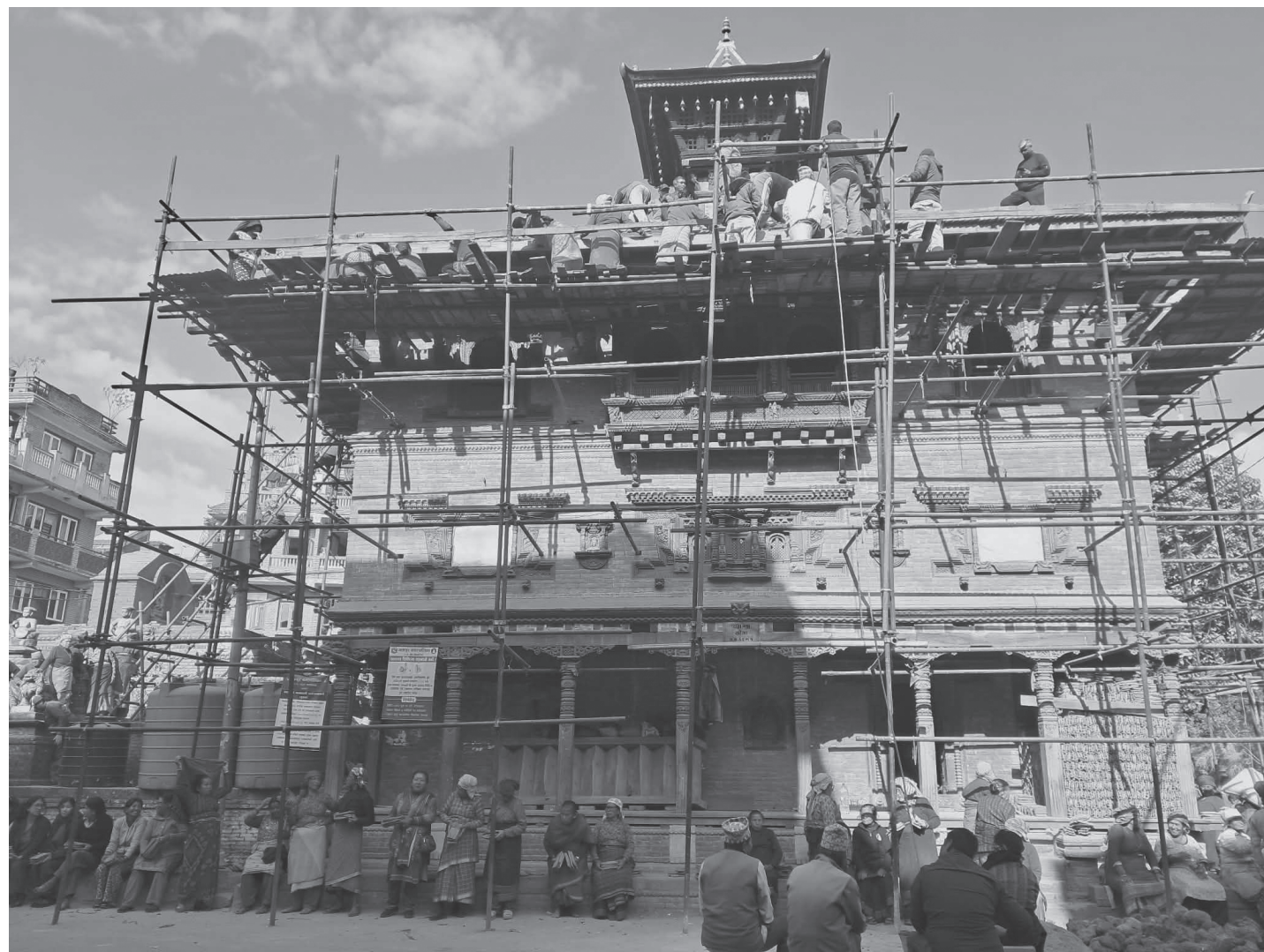
भक्तपुर नगरपालिका वडा नं. २ खोमास्थित इन्द्रायणी चोखे पुनर्निर्माणको छाना छाउने कार्यक्रममा श्रमदान गर्नुहुँदै स्थानीयहरू।