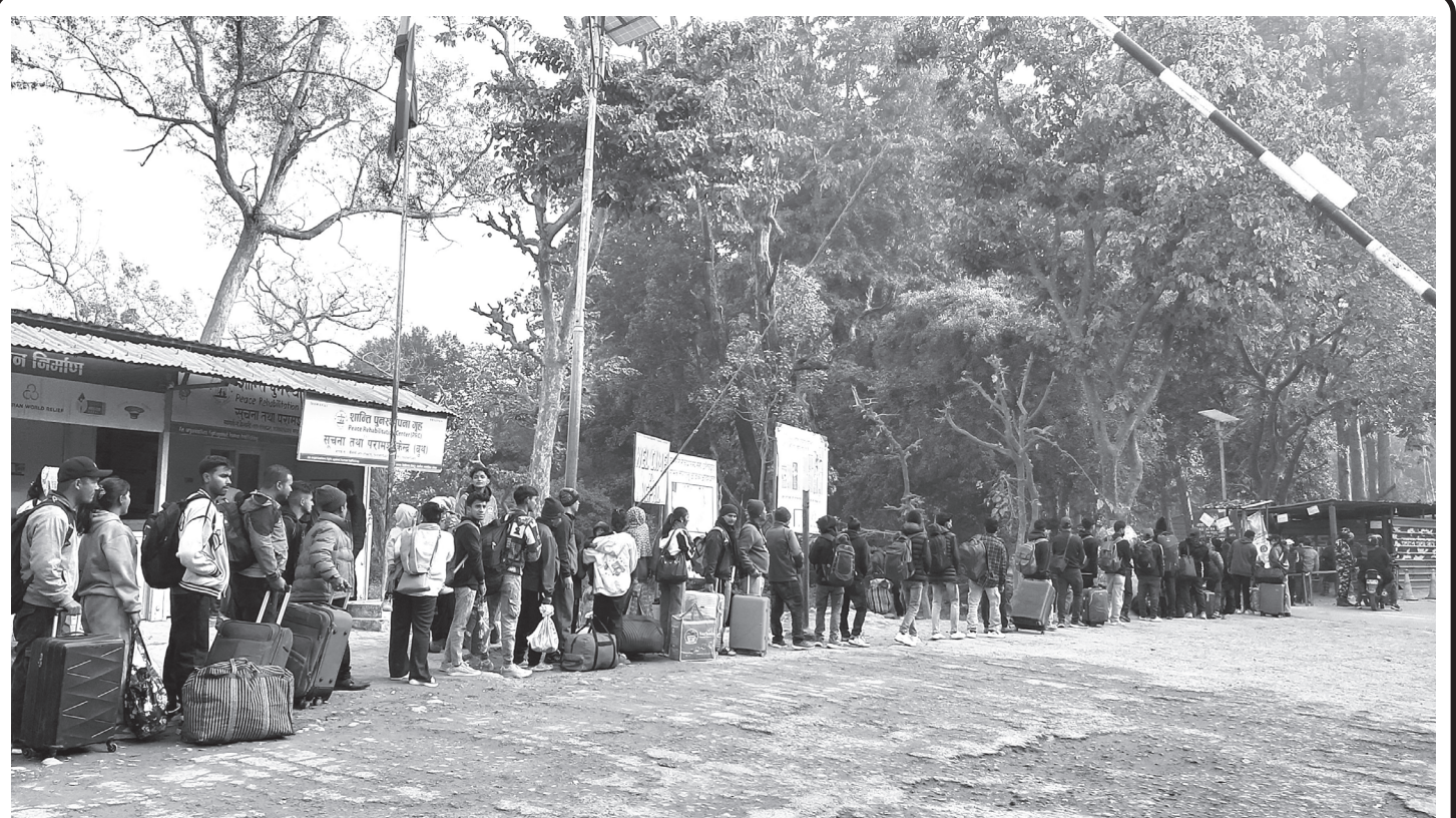
त्रिनगर नाकाबाट भारत प्रवेश गर्दै गरेका नेपालीहरू

उहाँले त्यसमध्ये सबैभन्दा बढी नेपालगञ्जको र सबैभन्दा कम कोहलपुर नगरपालिकाको रहेको उल्लेख गर्दै नाम दर्ताको रेकर्ड जिल्लामा नभएकाले दर्तामा दोहोरोपना देखिएको बताउनुभयो । "हामीले दर्ता गरेर केन्द्रमा पठाएपछि मात्रै थाहा पायौं । हाल नाम अद्यावधिक गर्ने कार्य जारी रहेको बताउनुभयो । मतदाता नामावलीको दोहोरो नाम हटाउने काम पुस ५ गतेसम्म जारी रहने छ," शाहीले भन्नुभयो ।