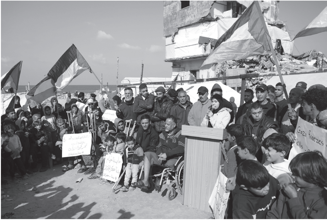
प्यालेस्टिनको गाजा सहरको पश्चिममा अवस्थित अल शाति शरणार्थी शिविरमा रहेका घाइते तथा सर्वसाधारण प्यालेस्टिनीहरू आँधी र बाढीबाट अत्यधिक पीडित भएपछि अस्थायी आवास र खाद्यान्न माग गर्दै प्रदर्शनमा बसेका प्यालेस्टिनीहरू डिसेम्बर १७, २०२५ का दिन। इजरायलले मानवीय सहायता र उपभोग्य वस्तु बोकेका गाडी पर्याप्त मात्रामा छिर्न नदिँदा गाजामा मानवीय विपत्ति कायम रहेको छ।