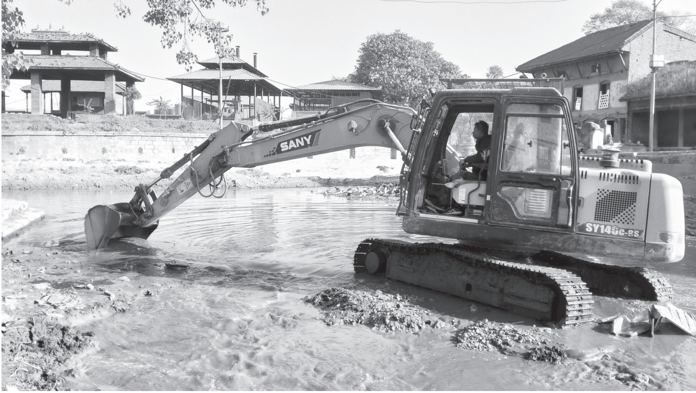
भक्तपुर नगरपालिका वडा नं. ७ स्थित प्रसिद्ध धार्मिकस्थल हनुमानघाटमा हनुमन्ते नदीमा थुप्रैको माटो निकालेर नदी सफाई गरिँदै शुक्रबार ।