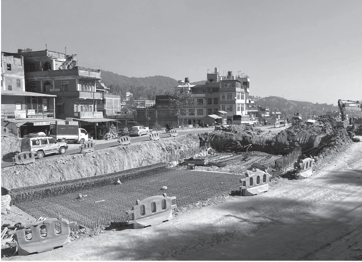
साँगामा निर्माणाधीन 'अन्डरपास'

अरनिको राजमार्गअन्तर्गत भक्तपुरको सूर्यविनायकदेखि काभ्रेपलाञ्चोकको धुलिखेलसम्म भइरहेको विस्तार कार्यअन्तर्गत साँगामा-धुलिखेल सडकखण्डको दुई जिल्लाको सीमाक्षेत्र साँगामा 'अन्डरपास' निर्माणको तयारी गरिँदै।