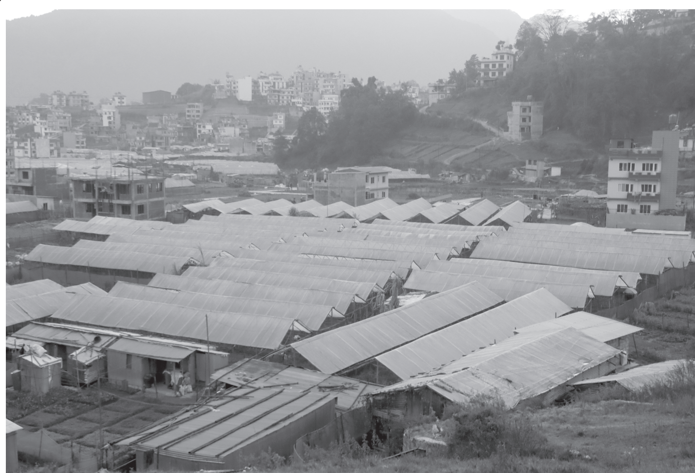
टनेलमा तरकारी खेती

काठमाडौंको तारकेश्वर नगरपालिका- ७ स्थित फुटुडमा किसानले व्यावसायिक रूपमा टनेलमा गरेको तरकारी खेती ।