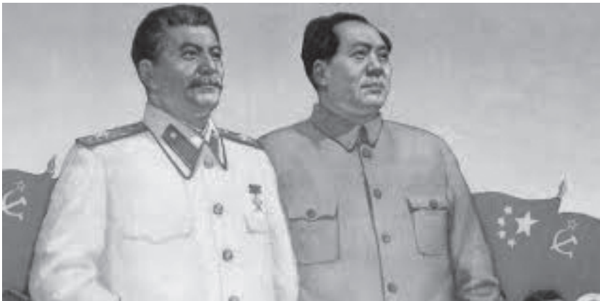
स्तालिन र माओ त्सेत्सुङ

स्तालिन र लेनिन हजारौं माइल टाढा भए पनि चिठीपत्रबाट उनीहरूको सम्पर्क कायमै थियो। लेनिनले साम्राज्यवादी युद्धको विरोध गर्नुभयो। साम्राज्यवादी युद्धलाई मजदुरवर्गले गृहयुद्धमा फेरि दिने सिद्धान्त अघि सार्नुभयो। मुखले समाजवादी र कामले साम्राज्यवादी नीतिको समर्थन गर्ने दोस्रो इन्टरनेसनलका समाजवादी-साम्राज्यवादी नेताहरूलाई पनि लेनिनले उदाइयाइदिनुभयो। स्तालिनले उहाँको युद्ध र शान्ति, गृहयुद्ध र क्रान्तिको नीतिको समर्थन गर्नुभयो। १९१५ को एक दिन कालापानीमा निकालिएका बोलशेविकहरूको एक बैठक भयो। मोनास्टिस्कोये गाउँमा भएको त्यस बैठकमा उहाँले कामेनेभजस्ताको हतियार बयानको निन्दा गर्नुभयो।