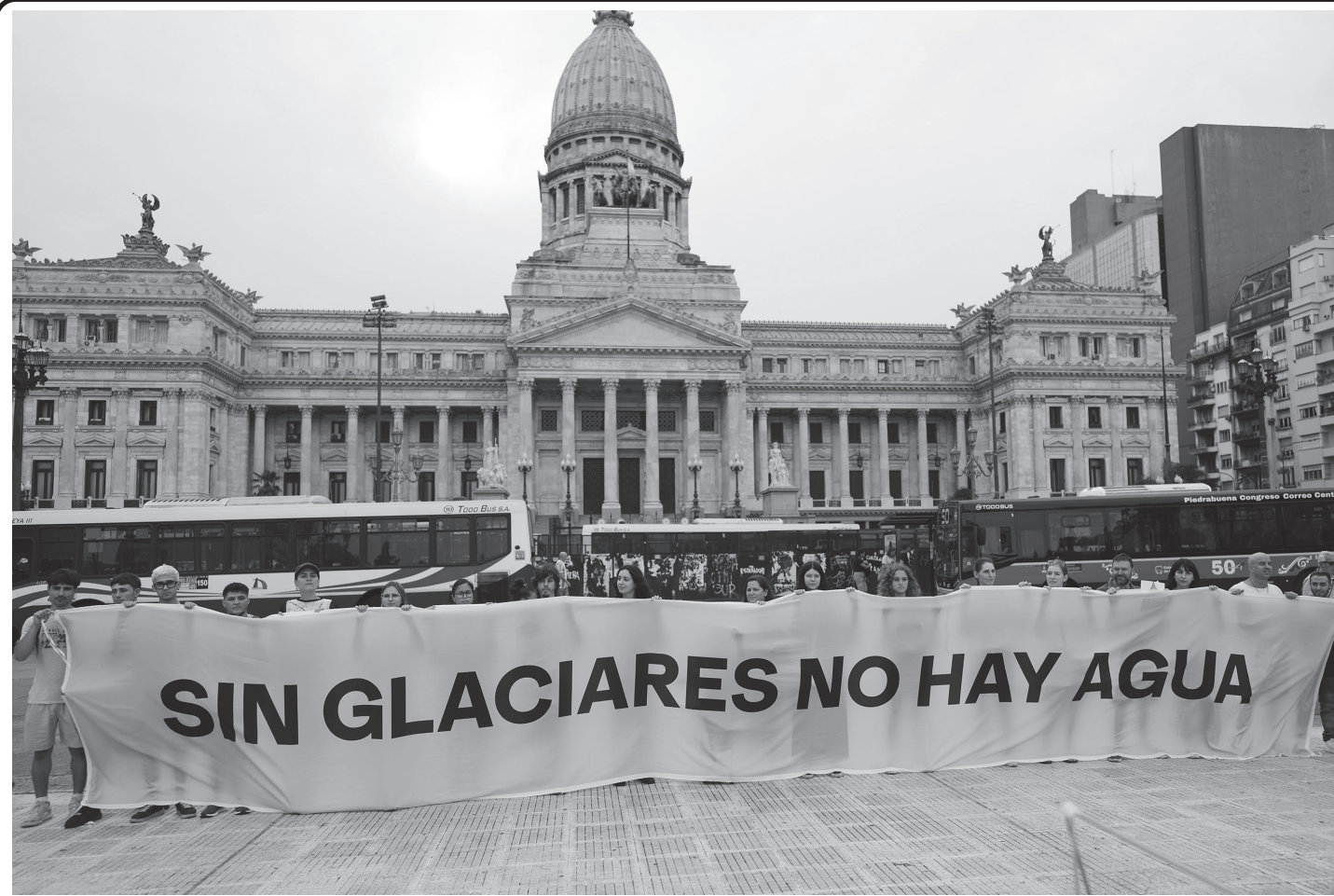
दक्षिण अमेरिकी देश अर्जेन्टिनाका दक्षिणपन्थी राष्ट्रपति ह्याभियर मिलेइ सरकारको वातावरण र हिमनदी बिगाने नीतिको विरोधमा राजधानी ब्यूनसआयर्सस्थित संसद् भवन अगाडि विरोध प्रदर्शन गर्दै वातावरणवादी अभियन्ता र कार्यकर्ताहरू डिसेम्बर २२, २०२५ का दिन। विरोध प्रदर्शनको क्रममा उनीहरूले बोकेको ब्यानरमा स्पेनिश भाषामा 'हिमनदीबिना पानी हुनेछैन' लेखिएको छ।