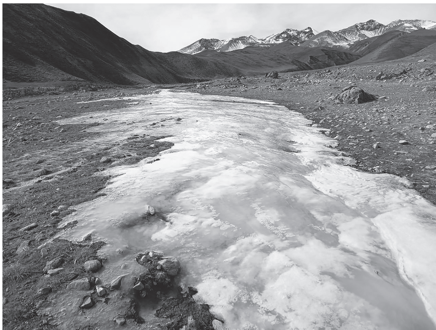
चिसोले जमेको खोला