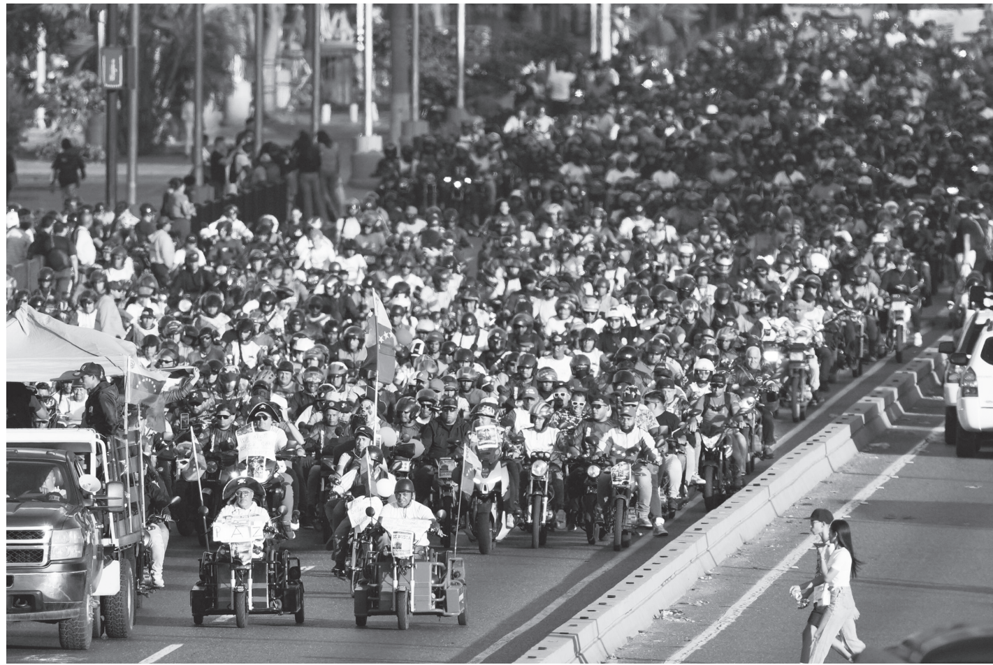
दक्षिणी अमेरिकी देश ब्रेजेजियालीको राजधानी काराकसमा संरा अमेरिकाको ट्रम्प प्रशासनले गरिरहेको हस्तक्षेप र आक्रमणको तयारीविरुद्ध प्रदर्शनमा उत्रेका मोटरसाइकल राइडरहरू डिसेम्बर २२, २०२५ का दिन । हजारौं राइडरहरूले राष्ट्रपति निकोलस मादुरो नेतृत्वको सरकारप्रति ऐक्यबद्धता जाहेर गरेका छन् ।

★ वर्ष : २७ ★ अङ्क : ३३६ ★ ने. सं. १९४६ पोहेला थव, चतुर्थी ★ बुधवार ★ ९ पुस, २०८२ ★ December 24, 2025, Wednesday ★ मूल्य रु.५१- ★ पृष्ठ ८