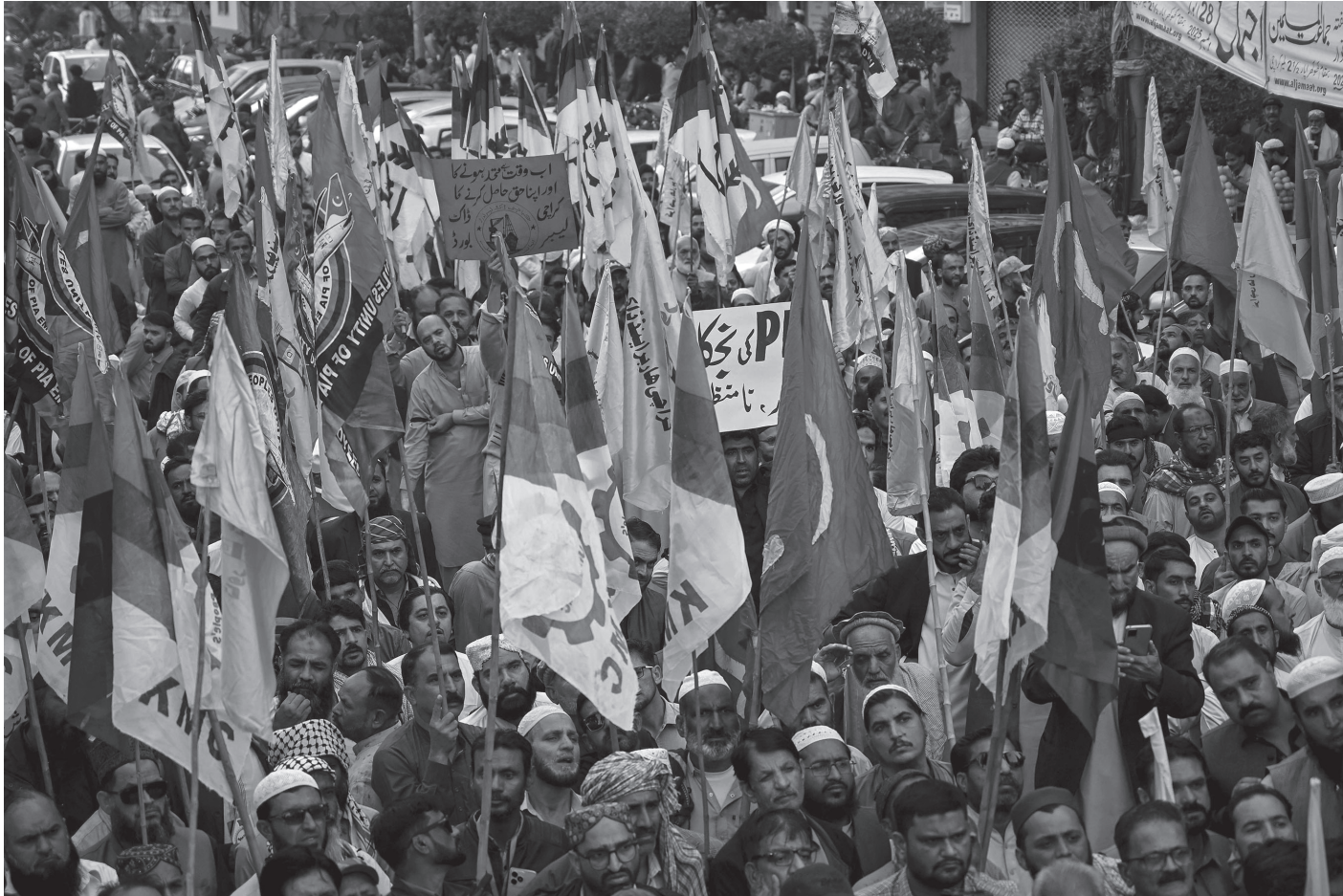
पाकिस्तानको औद्योगिक सहर कराँचिमा शरिफ सरकारको राज्य सञ्चालित उद्योगहरू पाँच वर्षका लागि निजीकरणमा पठाउने योजनाको विरोधमा प्रदर्शन गर्दै पाकिस्तानी औद्योगिक मजदुरहरू जनवरी २, २०२६ का दिन। सरकारले देशका २४ वटा विभिन्न क्षेत्रका उद्योगलाई तीन चरणमा निजीकरणमा पठाउने निर्णय गरेको थियो।