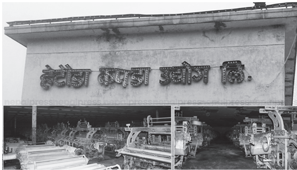
हेटौडा कपडा उद्योग

स्वास्थ्यमा ५० प्रतिशत र शिक्षामा २५ प्रतिशत सरकारी अनुदान कटौतीको रिपोर्ट सार्वजनिक भयो। यसको कारण पुनः पुँजीवादी उदारवादी अर्थनीतिलाई अवलम्बन गरी विश्व बैङ्क, अन्तर्राष्ट्रिय मुद्राकोषहरूको सर्तहरू पालना गर्नु नै हो। विश्व बैङ्क वा अन्तर्राष्ट्रिय