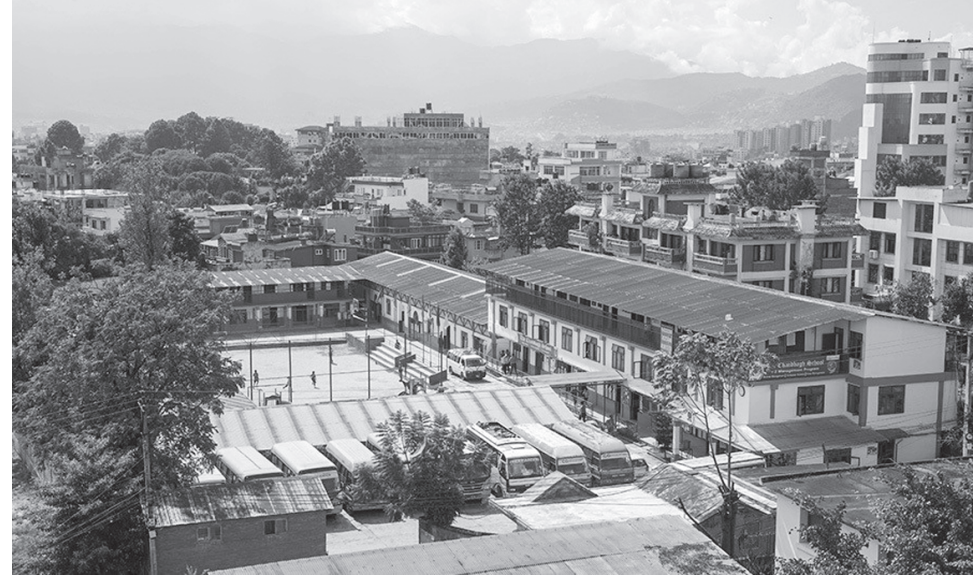
बाँसबारी छाला जुता कारखाना

विधेयकको प्रस्तावनामै स्वदेशी वा विदेशी निजी क्षेत्रको लगानीलाई परिचालन गरी व्यवस्थितरूपमा औद्योगिकीकरणको प्रक्रियालाई तीव्र बनाउने उल्लेख गरिएको छ। प्रधानमन्त्री स्वयं अध्यक्ष रहने गरी लगानी