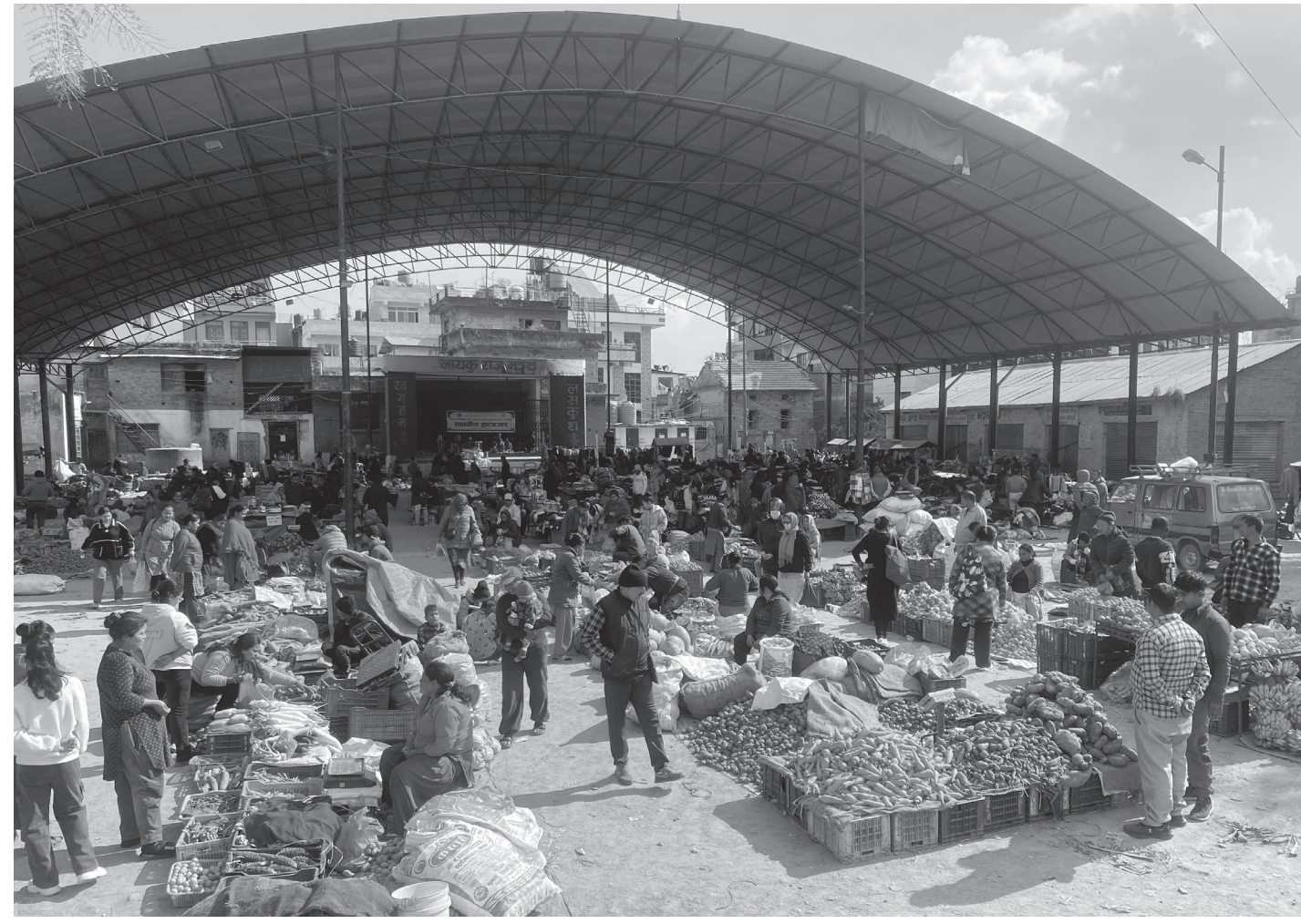
बनेपामा शुक्रबारे हाटबजार

काभ्रेपलाञ्चोकको बनेपा नगरपालिकाद्वारा लायकुली परिसरमा सञ्चालित 'शुक्रबारे हाटबजार'। डेढ वर्षदेखि नगरले हाटबजार सञ्चालनमा ल्याएपछि यहाँका किसानले उत्पादन गरेको विभिन्न वस्तुलाई बिक्रीका लागि सहज भएको बताएका छन्।