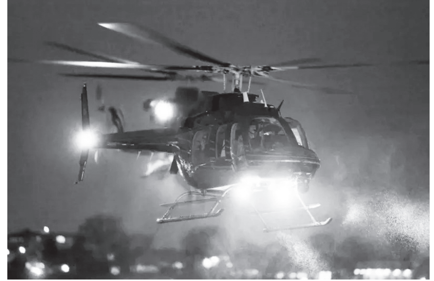
अपहरणका लागि प्रयोग गरिएका १५० हेलिकप्टरमध्ये एक

“उनी सुरक्षित स्थानमा जान प्रयास गरिरहेका थिए, तर त्यो सुरक्षित थिएन, किनभने हामी ४७ सेकेन्डमै ढोका उडाइदिन सक्थ्यौं,” ट्रम्पले भने।