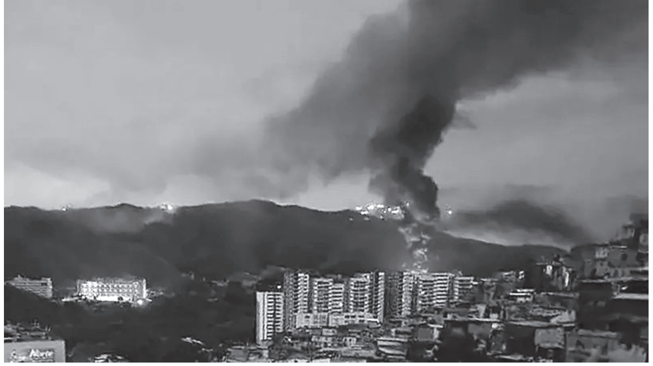
कराकासमा अमेरिकी मिसाइल हमला