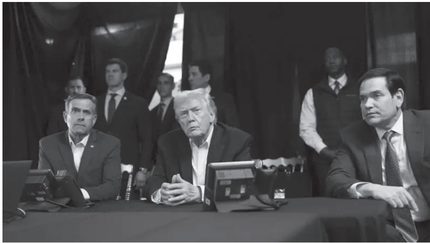
अपहरणको प्रत्यक्ष मिडियो हेर्दै ट्रम्पलगायत

“क्रिसमस र नयाँ वर्षको बिचतिरका साताहरूमा अमेरिकी सेनाका महिला र पुरुषहरू उपयुक्त सङ्केत र राष्ट्रपतिबाट आदेशको आउने प्रतीक्षामा पूर्ण तयारी अवस्थामा बसे,” सर्वोच्च सैनिक अधिकारी जेनरल ड्यान केनले शनिबार बिहानको पत्रकार सम्मेलनमा भने।