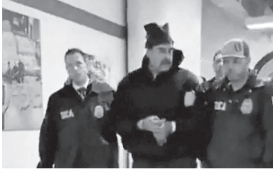
राष्ट्रपति मादुरोलाई अपहरण गरी लगिँदै

सैन्य अधिकारीहरू उपयुक्त मौकाको प्रतीक्षामा मात्र थिए।