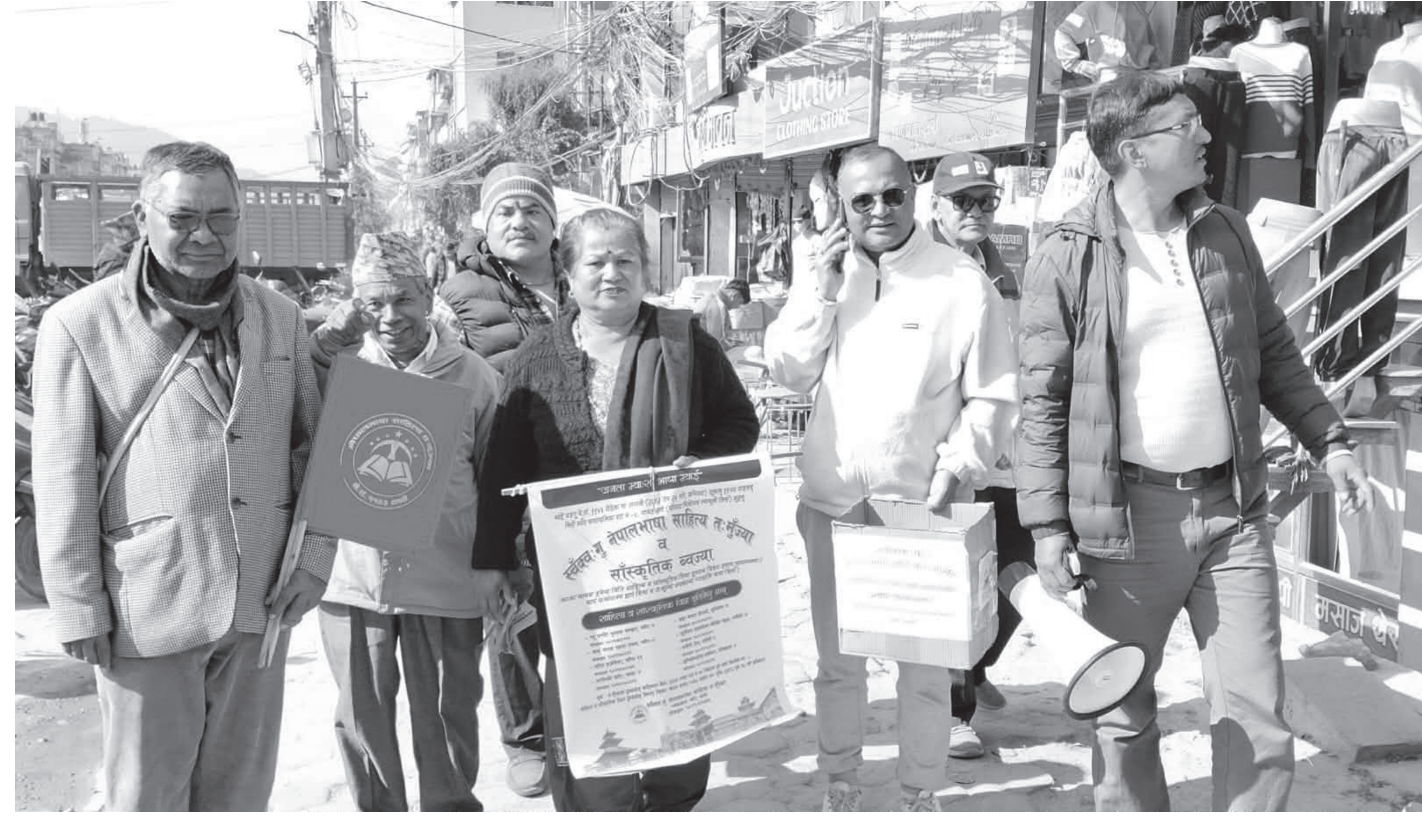
काभ्रेपलाञ्चोक जिल्लाको बनेपा नपा वडा नं ७ गा: बह:ननी टोलमा यहीं २६ गते हुन गइरहेको तेस्रो नेपालभाषा साहित्य त:मुंज्या एवं सांस्कृतिक प्रदर्शन सफल पार्न प्रचार प्रसार र आर्थिक सहयोग सङ्कलन हुँदै पुस २१ गते सोमबार ।