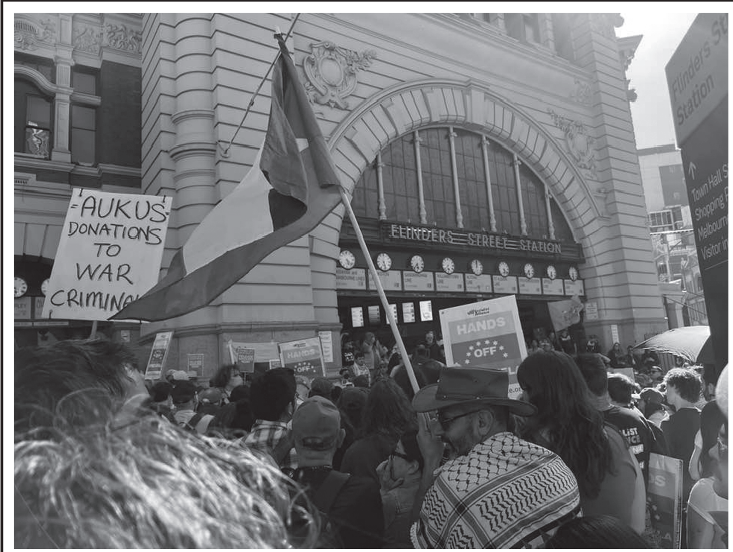
संरा अमेरिकाले भनेजुयलामाथि गरेको आक्रमण र राष्ट्रपति निकोलस मादुरो तथा उहाँको पत्नीको अपहरणविरुद्ध अस्ट्रेलियाको राजधानी मेलबर्नस्थित अमेरिकी दूतावास घेराउ गर्दै प्रदर्शनकारीहरू ४ जनवरी, २०२६ का दिन।