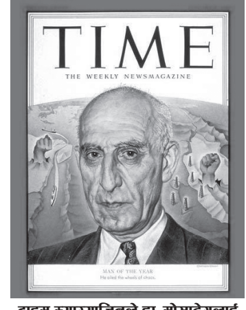
टाइम म्यागजिनले डा. मोसादेगलाई सन् १९५३ को वर्ष पुरुष घोषणा

बुझ्नेकै विषय हो। इरान इरानी जनताको हो, अफगानिस्तान, इराक र सिरिया पनि इरानका छिमेकी देश हुन्। प्राचीन सभ्यताको यो देशका जनता भए आफ्ना शासकलाई रुचाउँदैनन् तर देशलाई शिरमा राख्छन्, उनीहरूको देशप्रतिको अगाध माया र देशभक्तिको भावनाको कारण विदेशी हस्तक्षेप र दमनलाई सहँदैनन्। इतिहासले यही देखाउँदै आएको छ।