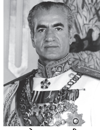
रेजा शाह पलहवी

साम्राज्यहरूले दुर्बल देशहरूमाथि गर्दै आएको राजनीतिक र आर्थिक शोषणलाई निन्दा गरे तथा यसको अन्त गर्न खोजें।... मैले आफ्नो जीवन, सम्पत्ति र परिवारलाई दाउमा राखेर, ईश्वरको कृपा र जनताको आकाङ्क्षालाई शिरोपर