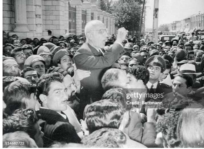
डा. मोहम्मद मासादेग जनतामाग

रूपमा अङ्गीकार गर्ने। तर, यी सबै योजना र नीतिलाई कार्यान्वयन गर्न ठुलो रकम आवश्यक थियो। यसको लागि तेल कारखानालाई राष्ट्रियकरण गर्नु अपरिहार्य थियो। संसदले तेल राष्ट्रियकरण गर्ने प्रस्तावलाई मार्च २०, १९५१ मा नै अनुमोदन गरिसकेको थियो। बेलायती सरकारले यस प्रस्तावलाई ठाडो अस्वीकार गर्‍यो र रेजा शाह पलहवीले विधेयकमा हस्ताक्षर