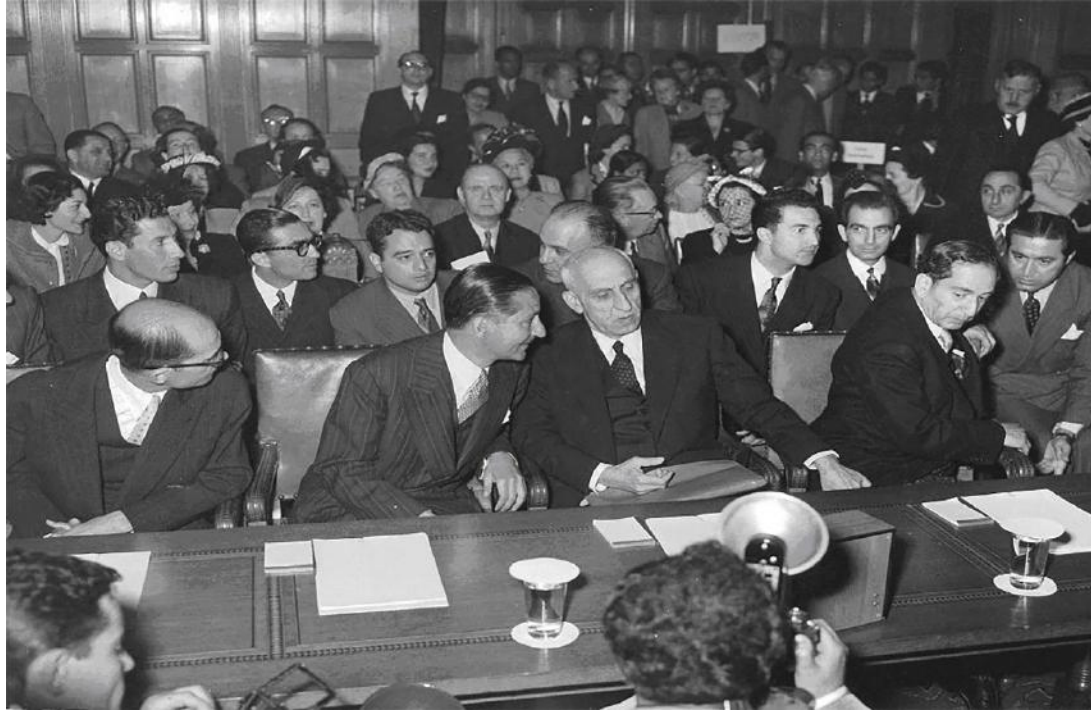
प्रधानमन्त्री मोसादेग अन्तर्राष्ट्रिय न्यायालयमा आफ्नो दलिल पेश गर्दै।

यतिमात्र होइन अझ तेल कारखानामा काम गर्ने इरानी कामदारहरूले उनीहरूको आफ्नै भूमिमा बेलायतीहरूबाट धेरै दुर्व्यवहार र अपमान सहनुपर्थ्यो। यस्तै, अपमानका कारण बेलाबेलामा मजदुरहरूले हडताल गर्थे। यस्तै, एउटा हडतालको क्रममा प्रहरी दमनका कारण २०० जना कामदारले