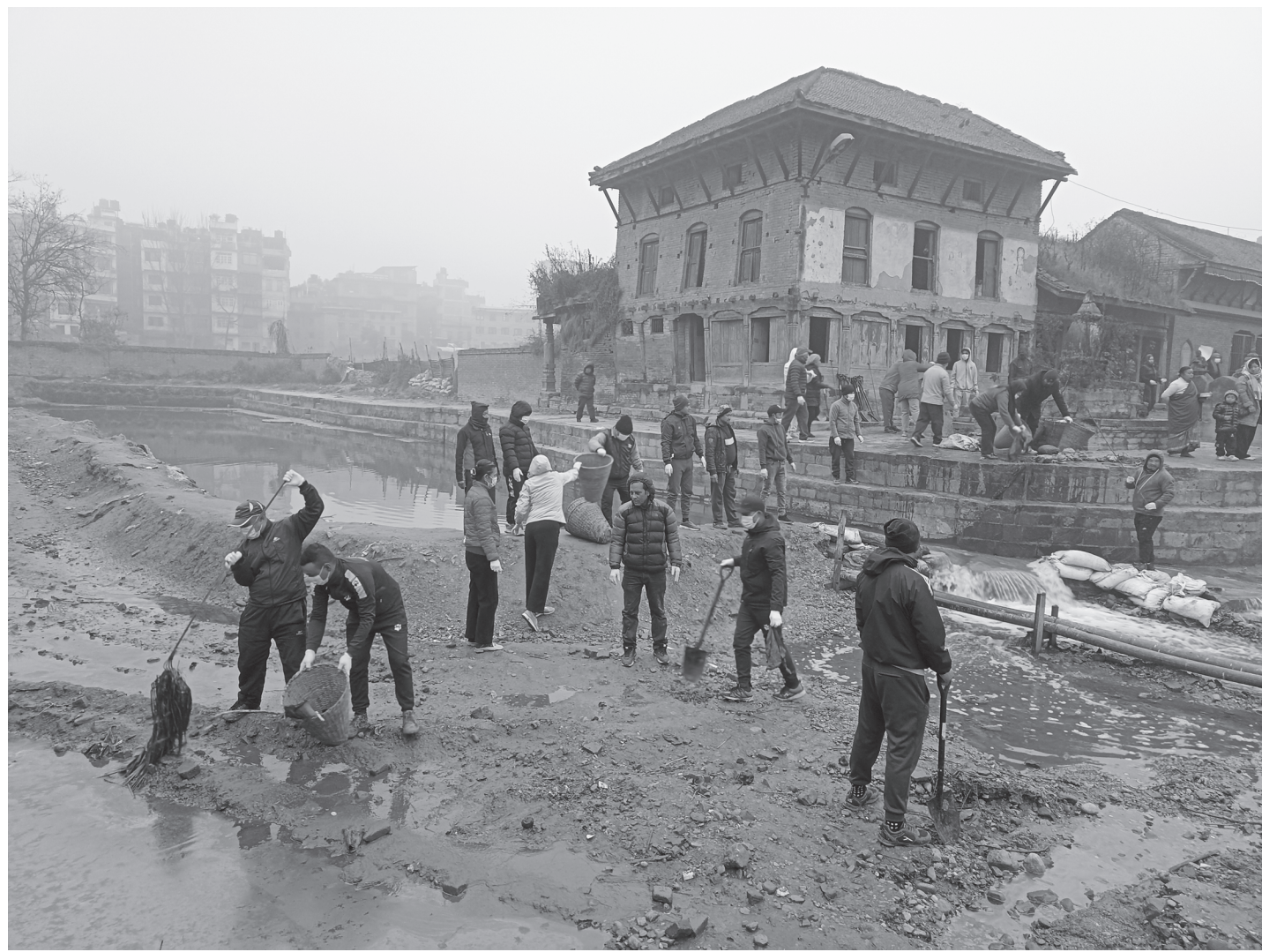
भक्तपुर नगरपालिकाको आयोजनामा नियमित पाक्षिक सरसफाइ कार्यक्रमअन्तर्गत माघ १५ गते हनुमानघाट परिसरमा सरसफाइ कार्यक्रम गर्दै ।