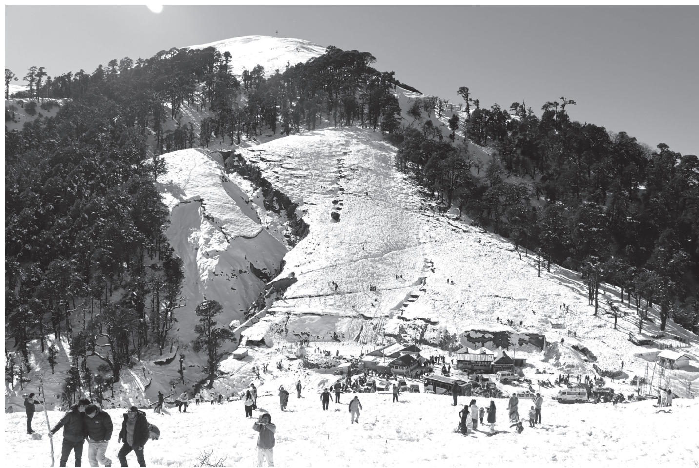
हिउँमा मनोरञ्जन लिँदै पर्यटक

रुकुम पूर्व, रोल्पा र बागलुङ सिमाना पातिहाल्ना क्षेत्रमा परेको हिउँमा मनोरञ्जन लिँदै आन्तरिक पर्यटक।