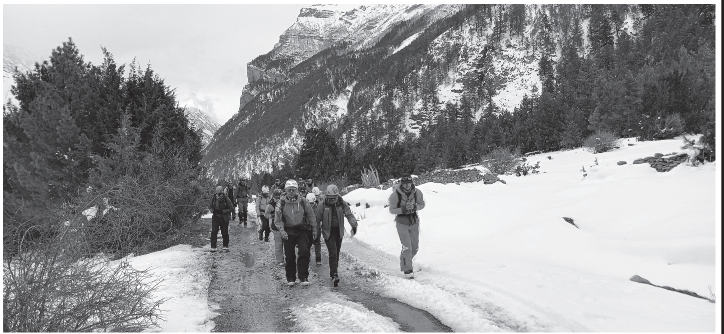
माथिल्लो मनाङतर्फ जाँदै पर्यटक