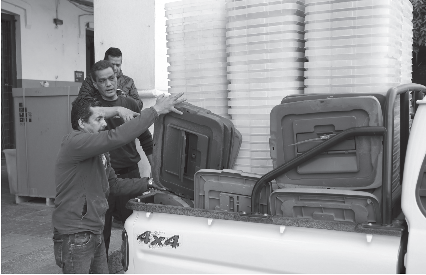
गाडीमा लोड गरिँदै मतपेटिका

कान्तिपथस्थित बहादुर भवनमा रहेको निर्वाचन आयोगको कार्यालयबाट प्रतिनिधिसभा सदस्य निर्वाचन २०८२ का लागि ललितपुर जिल्ला निर्वाचन कार्यालयमा पठाउन गाडीमा लोड गरिँदै मतपेटिका।