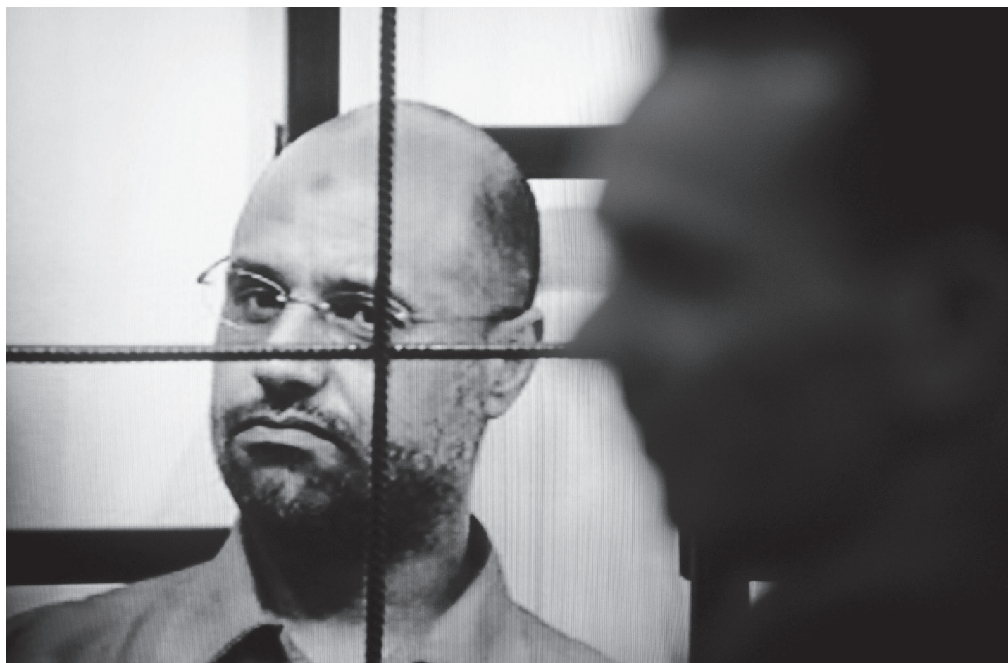
उत्तर अफ्रिकी देश लिवियाका नेता मुआम्मर गद्दाफीको छोरा सैफ अल इस्लाम गद्दाफीको २०१४ को अप्रिलमा हिरासतमा रहेको अवस्थाको फाइल फोटो। नयाँ शासनको अदालतबाट निर्दोष साबित भई पश्चिम लिवियाको जिन्नान नगरमा सामान्य जीवन बिताइरहेका गद्दाफीमाथि फेब्रुअरी ३, २०२६ मङ्गलबारका दिन अज्ञात बन्दुकधारीहरूले कैयौं गोली प्रहार गरी हत्या गरेको लिवियाको महान्यायाधिवक्ताको कार्यालयले पुष्टि गरेको। हत्याराहरूको खोजी भइरहेको त्यहाँको सरकारले दाबी गरेको छ।