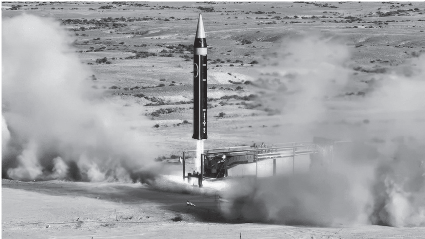
इरानको एक अज्ञात स्थलबाट शुक्रबार प्रक्षेपण परीक्षण गरिएको खुरमसहर -४ ब्यालेस्टिक मिसाइल। उक्त मिसाइलले आणविक अस्त्र बोक्न र २ हजार किलोमिटर टाढासम्म लक्ष्यभेदन गर्न सक्ने बताइएको छ।