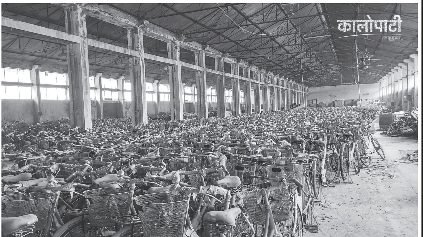
मधेश प्रदेशमा लालबाबु राउत नेतृत्वको पहिलो सरकारले सुरु गरेको 'मुख्यमन्त्री बेटी पढाउ, बेटी बचाउ' कार्यक्रमअन्तर्गत २७ हजारभन्दा बढी साइकलमध्ये चार हजारभन्दा बढी साइकल जनकपुरस्थित चुरोट कारखाना (मधेश भवन)को गोदाममा थन्किएका छन् ।

त्यस अवसरमा प्रतियोगिताका विजयी धावकलाई प्रधानसेनापति अशोकराज सिग्देल, पूर्वप्रधानसेनापतिहरू, सैनिक श्रीमती सङ्घकी अध्यक्ष, बलाधिकृत, नेपाल सरकारका सचिव तथा काठमाडौं महानगरपालिका प्रतिनिधिले पुरस्कार तथा प्रमाणपत्र वितरण गर्नुभयो । रासस