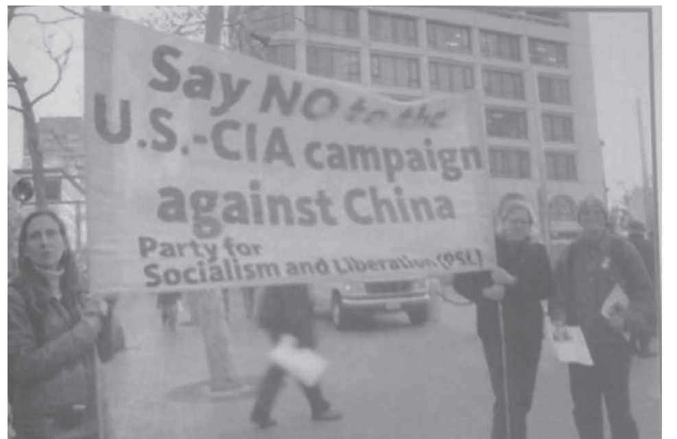
‘चीनविरोधी अमेरिकी - सीआईए अभियानको विरोध गरौं’ लेखिएको ब्यानर लिई युरोपमा भएको एक प्रदर्शन।

सन् १९६० को सुरुमा जोन एफ केनेडी अमेरिकामा राष्ट्रपति भएपछि उनले चीनसम्बन्धी