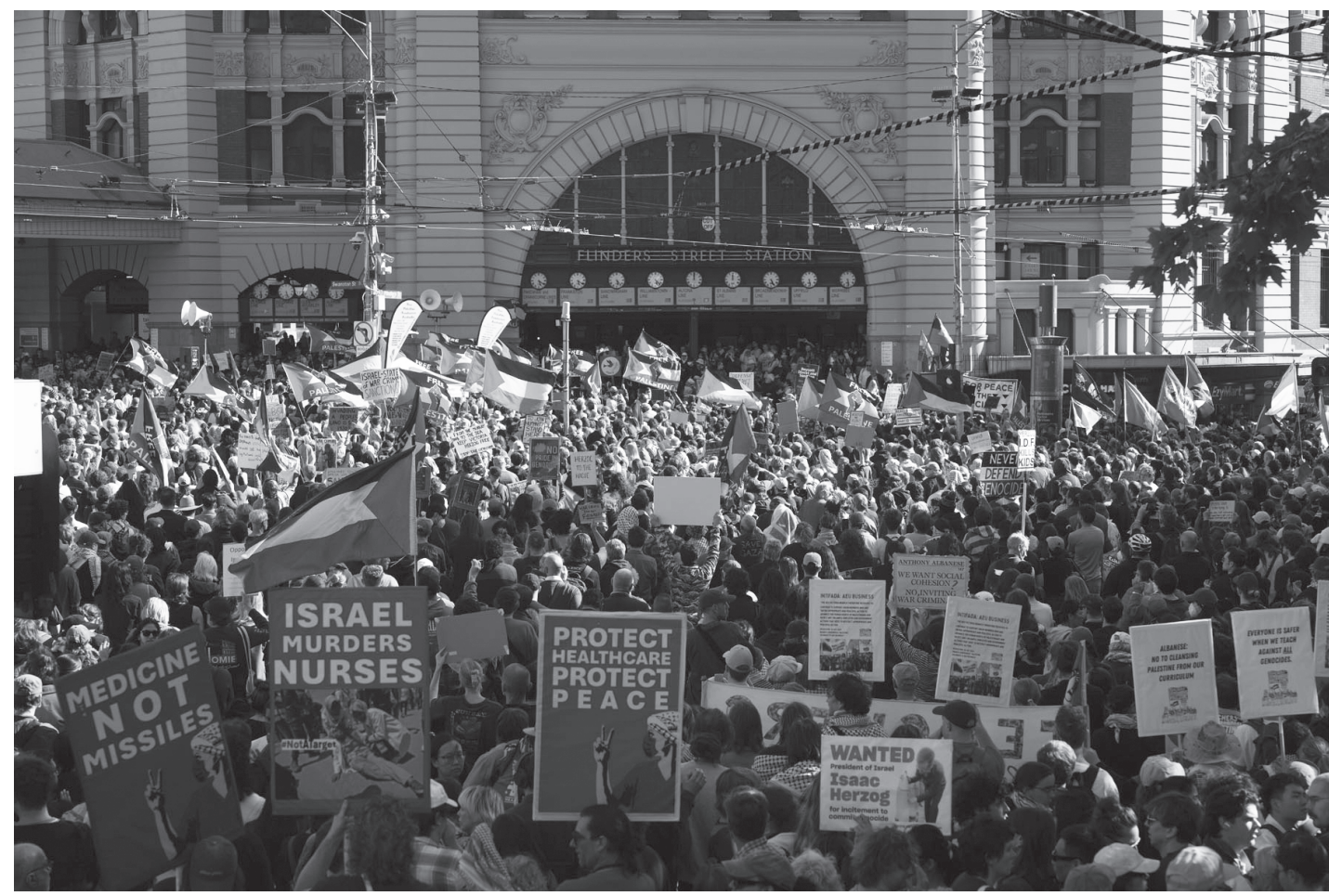
इजरायली राष्ट्रपति आइज्याक हर्जोङको अस्ट्रेलिया भ्रमणविरुद्ध 'इजरायल हत्यारा हो अस्ट्रेलियामा स्वागत छैन' भनी प्यालेस्टिनी भन्डासहित विरोध प्रदर्शन गर्दै अस्ट्रेलियाली जनता फेब्रुअरी १२, २०२६ का दिन। प्रदर्शनकारीहरूलाई तितरवित्र पार्न प्रहरीले दर्जनौं राउन्ड अश्रु ग्यास हानेको र लाठीचार्ज गरेको थियो।