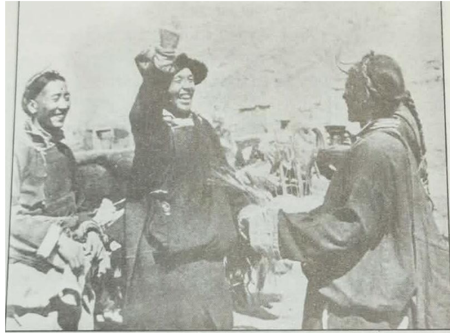
दास-मालिकको नियन्त्रणबाट मुक्त भएपछि पूर्व भूदासहरू पहिलो पटक जमिन जोत्ने तयारीमा एक परम्परागत समारोह गर्दै।

लामो सामन्ती शासनमा मठहरू स्वयम्बाट धर्माधिकारी शासनको अभ्यास भएको थियो। तिनीहरूको स्वामित्वमा रहेको धेरै जग्गाजमिन तिनीहरू अरुलाई गर्न दिन्थे र दबाउँथे। माथिल्ला तहका लामाहरू ल्हासामा