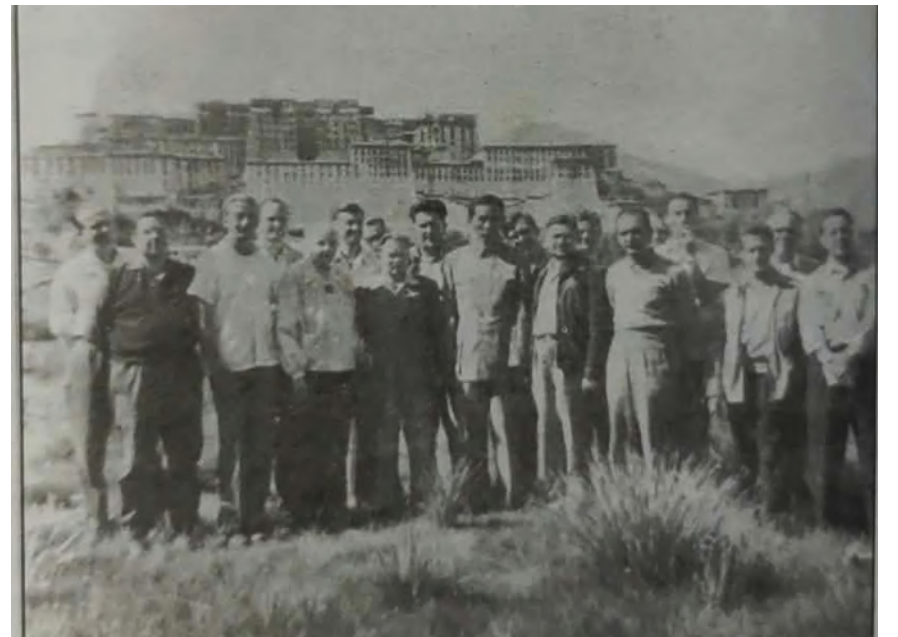
सन् १९५९ मार्चमा १२ देशका १२ जना पत्रकारहरू पोताला दरबारमा

१९५५ मा तिब्बत भ्रमण गरिसकेका प्रतिनिधिले तिब्बतमा पहिले कहिल्यै सुखी