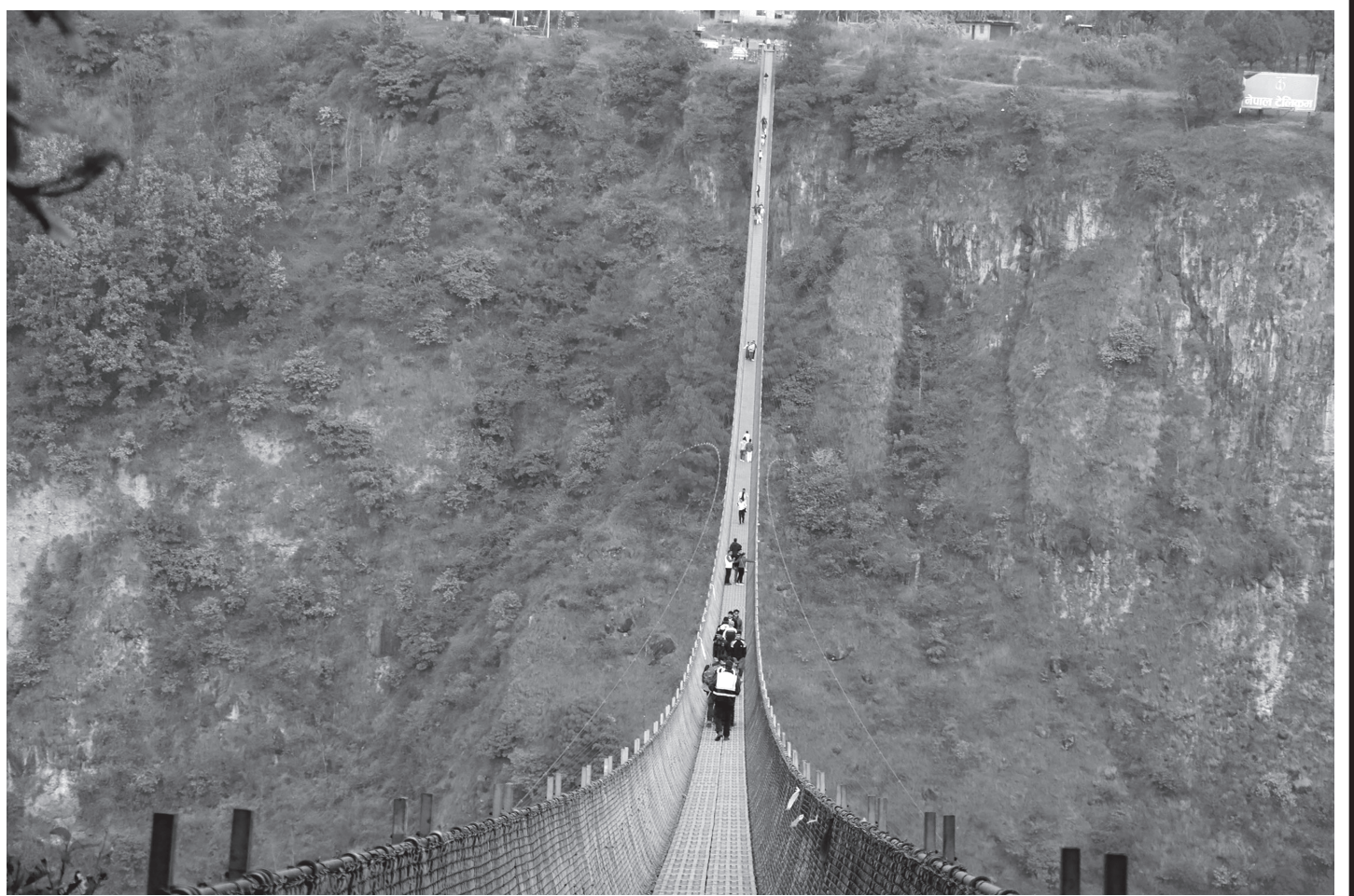
भोलुङ्गे पुलमा पर्यटक

दाङको घोरालीमा हुने कार्यक्रममा सहभागी हुन राष्ट्रिय स्वतन्त्र पार्टीका सभापति रवि लामिछाने र नेता बालेन्द्र शाह आउने खबर पाएपछि दाङ तुलसीपुरको वीरेन्द्र चौकमा भेला भएका समर्थकहरूको भिडमा भन्डा जलाइएको थियो । रासस