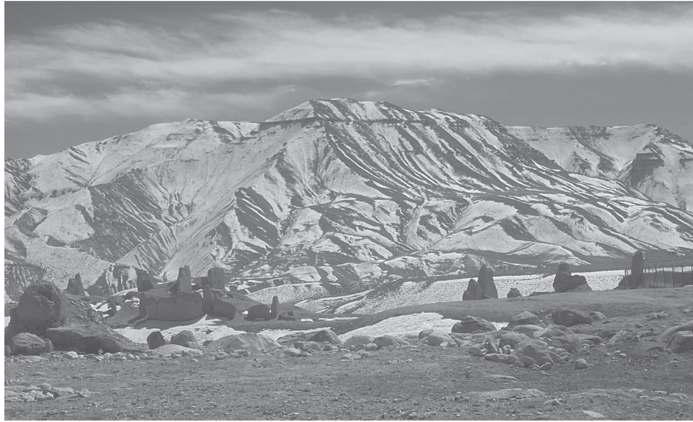
लोमान्थाडबाट देखिएको हिमशृङ्खला

मुस्ताङको लोमान्थाड गाउँपालिका-५ लोमान्थाड गाउँ नजिकैबाट देखिएको सेताम्मे हिमशृङ्खला र आसपासका क्षेत्र। गत माघ दोस्रो सातामा परेको हिउँ अझै पगिलएको छैन।