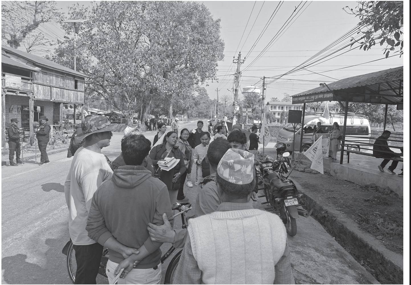
चितवनको भरतपुर महानगर क्षेत्रमा निर्वाचन प्रचारप्रसार गर्दै नेमकिपाका उम्मेदवारलगायत कार्यकर्ताहरू आइतबार ।