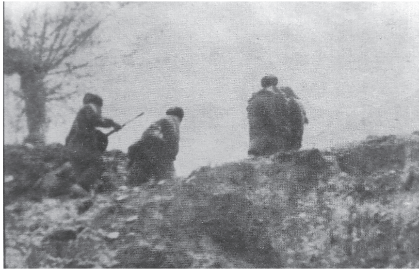
सन् १९५९ मार्चमा जनमुक्ति सेनाको मुख्य टुकडी आइरन हिल पुरदै । विद्रोहीको कब्जाबाट आइरन हिललाई ३ घण्टामा मुक्त पारिएको थियो ।

कुब्ला खाँका पालादेखि तिब्बतमा भएका सबै आधारभूत परिवर्तनलाई र दलाई लामाको संस्थासमेतलाई चिनियाँ सम्राटहरूले मान्यता दिँदै आएका थिए । दलाई लामा र पन्चेन एङ्गेनी पद सँगै आएका थिए । दलाई लामा र पन्चेन एङ्गेनी पदसँगै तिनीहरूको लौकिक शक्ति धर्माधिकार