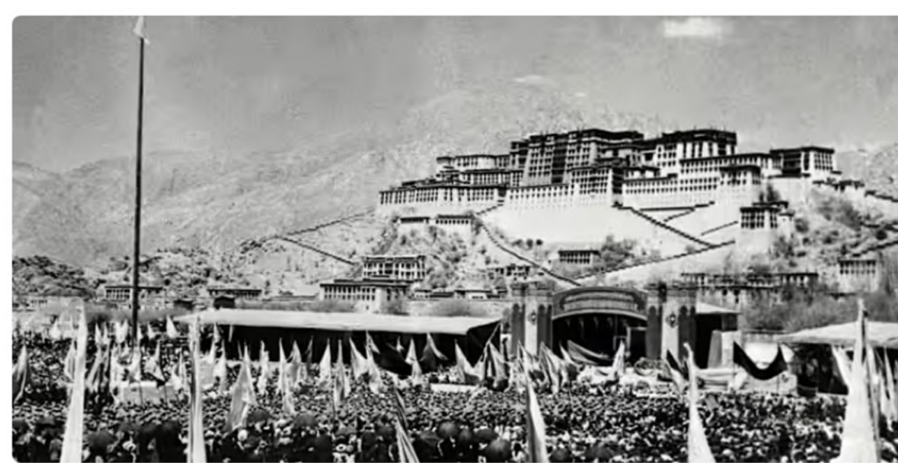
नयाँ योजना सुन्न २० हजार जनता ल्हासामा भेला भए, सन् १९५९ अप्रिल १५

वक्तव्यहरू निस्किए। यीमध्ये जून ३० को दिन दलाई लामाको उपस्थितिमा पत्रकार सम्मेलन गरेर अङ्ग्रेजीमा निकालिएको वक्तव्य अझ बढी कडा थियो। त्यसमा १९५९ को सम्झौतादेखि आजसम्म पेचिङले तिब्बतप्रति गर्दै आएको कार्यको भर्त्सना, तिब्बतको मुक्ति र 'विशाल तिब्बत' (Greater Tibet) को माग र पेचिङसँग प्रत्यक्ष सम्पर्क नगर्ने, पेचिङको कुरामा विश्वास नभएकोले ऊसित