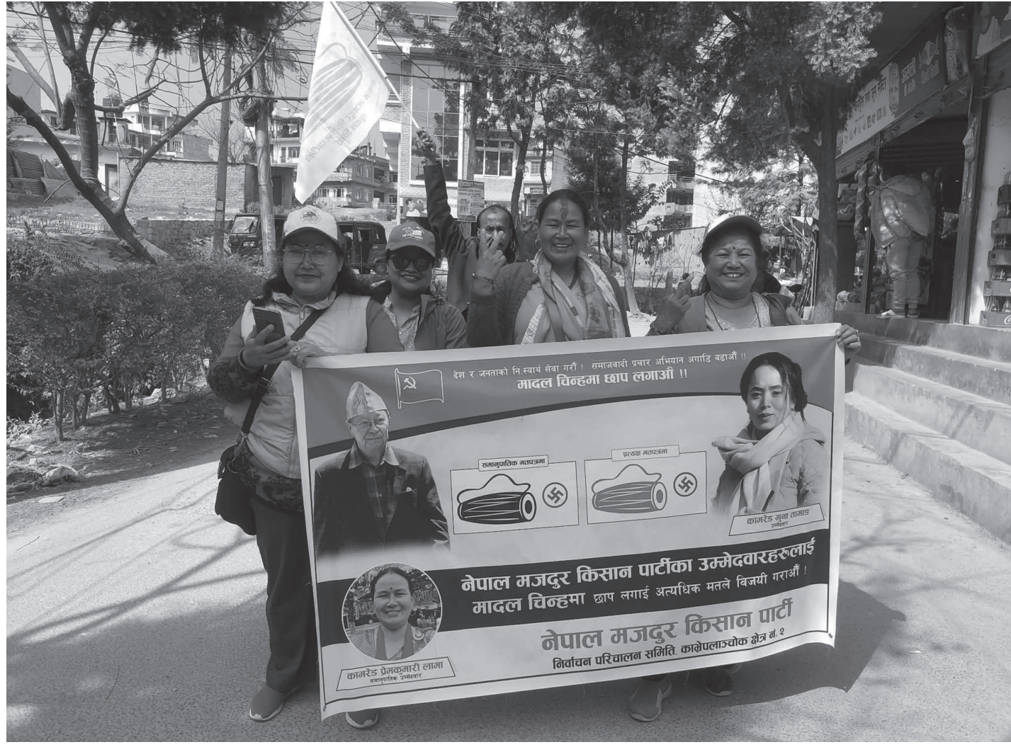
काभ्रेपलाञ्चोक क्षेत्र नं. २ नाला र बनेपामा नेपाल मजदुर किसान पार्टीको घरदैलो प्रचारप्रसार २०८२ फागुन ११ गते सोमबार।