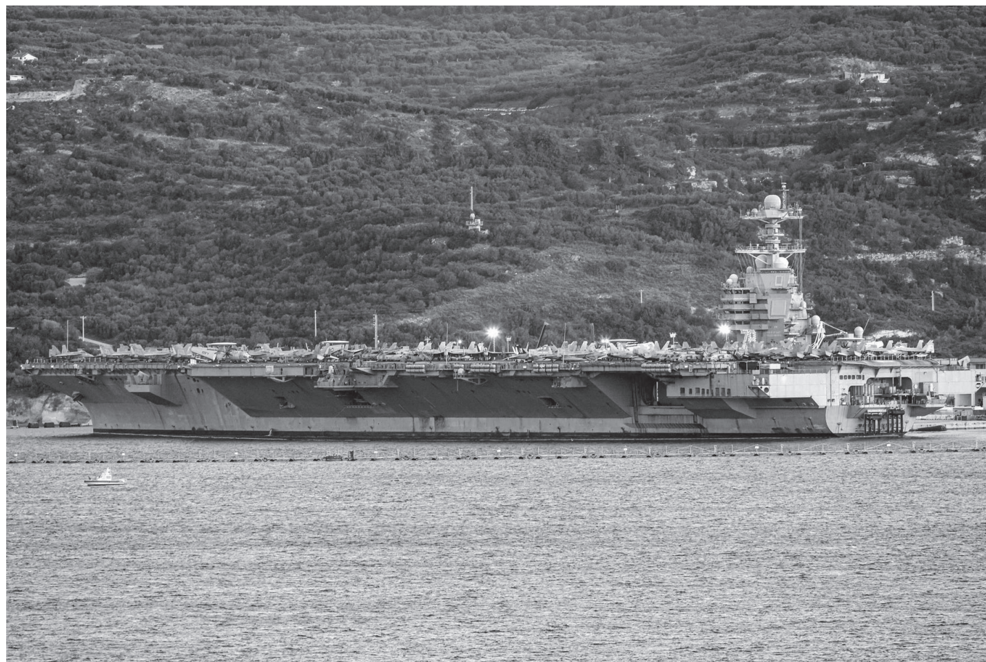
इरानसित जेनेभामा वार्ता गर्न लागेको संरा अमेरिकाले आफ्नो युद्धकविमान वाहक यूएसएस जेराल्ड फोर्ड ग्रीसको क्रेटसहित भूमध्य सागरको सौदा बन्दरगाहमा ल्याइएको छ। उक्त स्थानबाट उडेको विमानले इरान, इराक, लेबनान र इजिप्टमाथि समेत आक्रमण गर्न सहज हुने बताइएको छ।