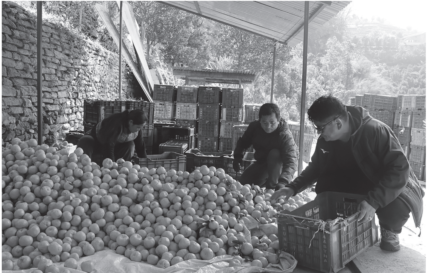
सुन्तला बजार पठाउने तयारी गर्दै दोसल्लेका किसान

तर, सुर्खेत र नेपालगञ्जसम्मको भाडा अत्यधिक महँगो भएको भन्दै स्थानीय असन्तुष्ट छन् । बिरामीलाई लक्षित सेवा नै यति महँगो हुँदा गरिब तथा विपन्न नागरिकको जीवनसँग खेलबाड भएको स्थानीयको गुनासो छ । जिल्ला एम्बुलेन्स समितिले भने भाडादर दूरी, इन्धन खर्च, मर्मतसम्भार तथा चालक खर्चलाई आधार मानेर निर्धारण गरिएको जनाएको छ । रासस