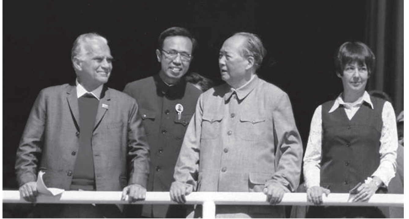
सन् १९६० मा एडगर स्नो अध्यक्ष माओका साथ

निक्सन पेइचिङ हवाई अड्डामा हवाईजहाजको सिँडीबाट तल भरी हात मिलाउन