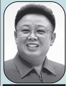
किम जोङ इल

हामीले सही नीति र नेतामा केन्द्रित एकता र सम्बद्धताको परम्परालाई रक्षा गर्नुपर्दछ र क्रान्तिको प्रेरक शक्तिलाई निरन्तर सुदृढ पारिरहनुपर्दछ ।