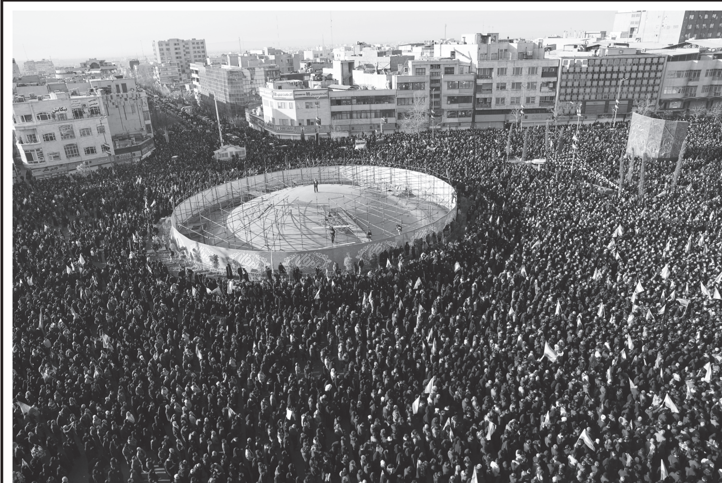
अमेरिकी-इजरायली हवाई मिसाइल हमलामा आफ्नो देशका सर्वोच्च नेता आयतोल्लाह सैयद अलि खामेनीको हत्या भएपछि त्यसको विरोधमा र आफ्ना नेताको निधनको शोक प्रकट गर्न राजधानी तेहरानको मुख्य सडकमा निस्केका इरानी जनता मार्च १, २०२६ का दिन।