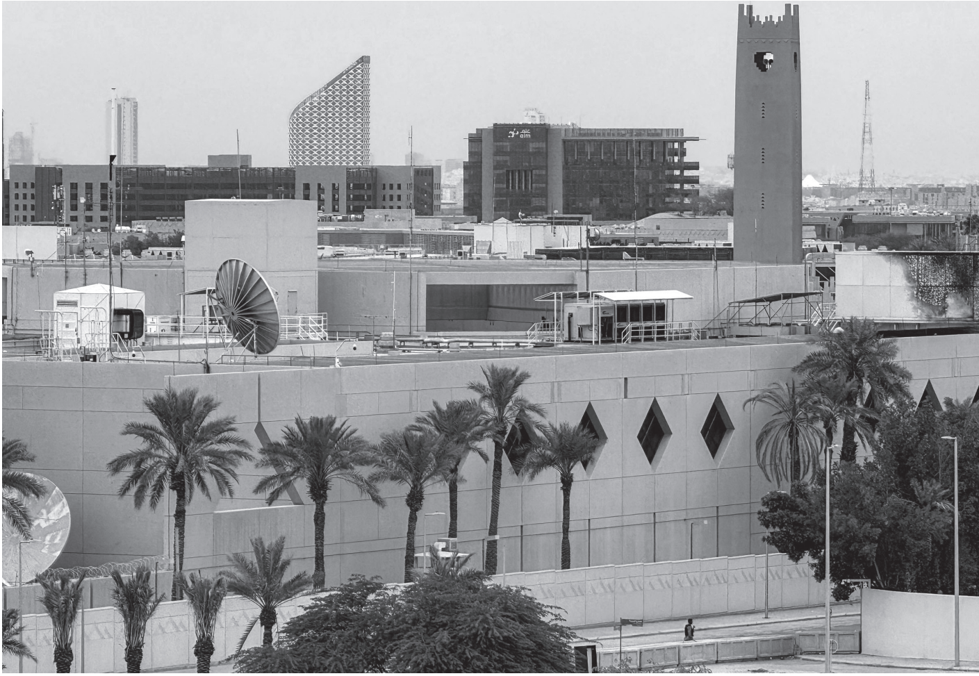
इरानी ड्रोन बम हमलाबाट आशिक रूपमा क्षतिग्रस्त बनेको साउदी अरेवियाको राजधानी रियादस्थित अमेरिकी राजदूतावास भवन मार्च ३, २०२६ का दिन। यही भवनबाट मध्यपूर्वमा अमेरिकी गुप्तचर विभाग -सिआइए सञ्चालन भइरहेकोले यसै भवनलाई निशाना बनाइएको बताइएको छ।