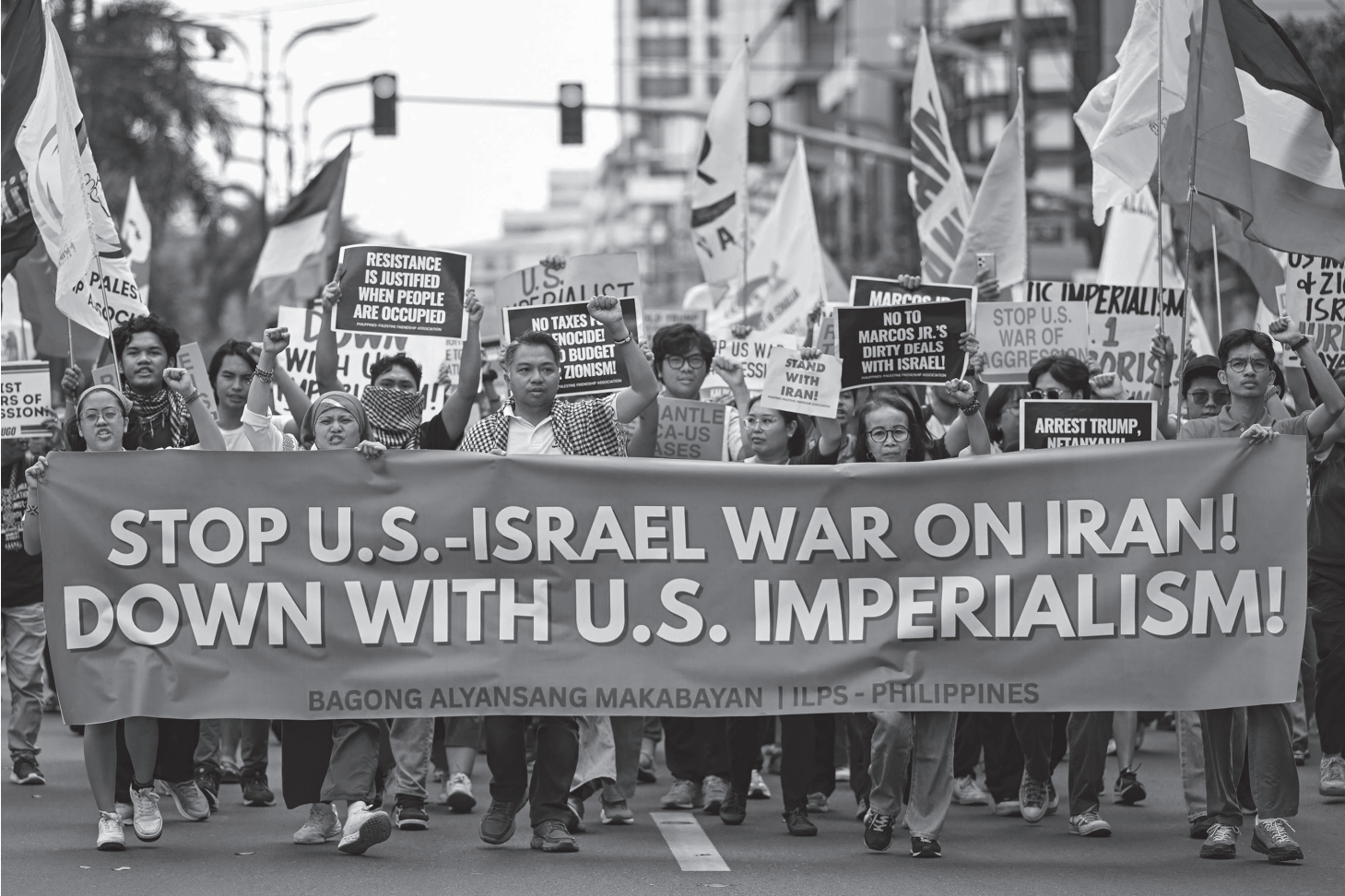
संरा अमेरिका र इजरायलले इरानमाथि गपिररहेको आक्रमणको निन्दा गर्दै र युद्ध तुरुन्त बन्द गर्न माग गर्दै दक्षिणपूर्वी एसियाली देश फिलिपिन्सको राजधानी मनिलास्थित अमेरिकी राजदूतावासअगाडि विरोध प्रदर्शन गर्दै फिलिपिन्सका युवाहरू मार्च ३, २०२६ का दिन ।

★ वर्ष : २८ ★ अङ्क : ४० ★ ने. सं. ११४६ चिल्ला गा, प्रतिपदा ★ बुधवार ★ २० फागुन, २०८२ ★ March 4, 2026, Wednesday ★ मूल्य रु.५१- ★ पृष्ठ ८