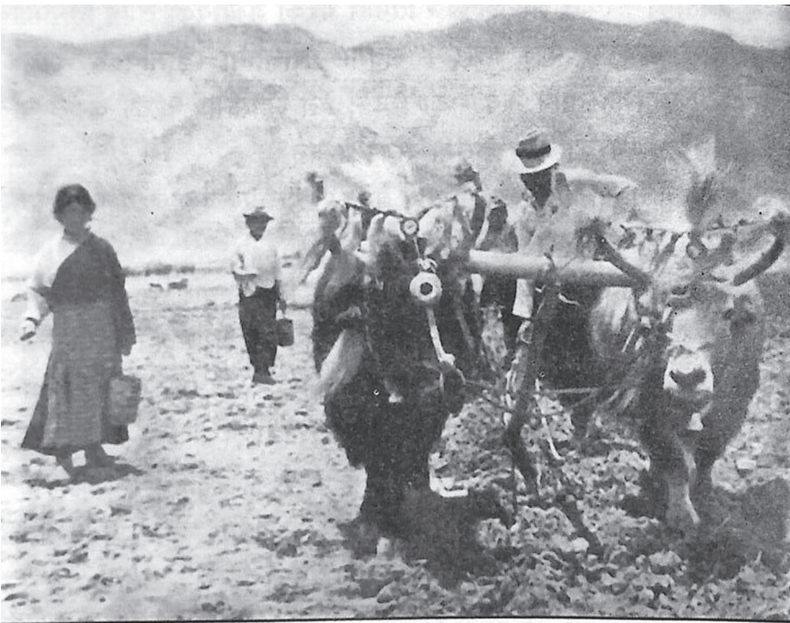
ल्हालुबाट नियन्त्रणमा लिइएको 'जमिन जोत्नेलाई'