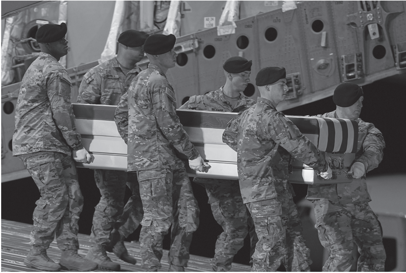
संरा अमेरिकाको डिलावर्सस्थित डोभर एयर फोर्स आधार शिविरमा मध्यपूर्वका देशहरूमा रहेका अमेरिकी सेनाका आधारमा इरानी मिसाइल हमलामा परी मारिएका अमेरिकी जलसेनाका सदस्यहरूको शव विमानबाट उतारिँदै मार्च ९, २०२६ का दिन। एकैदिन ५० भन्दा बढी शव आएको हुनाले अमेरिकी सेनाको हटाहटी अफ्र बढी हुनसक्ने अनुमान गरिएको छ।