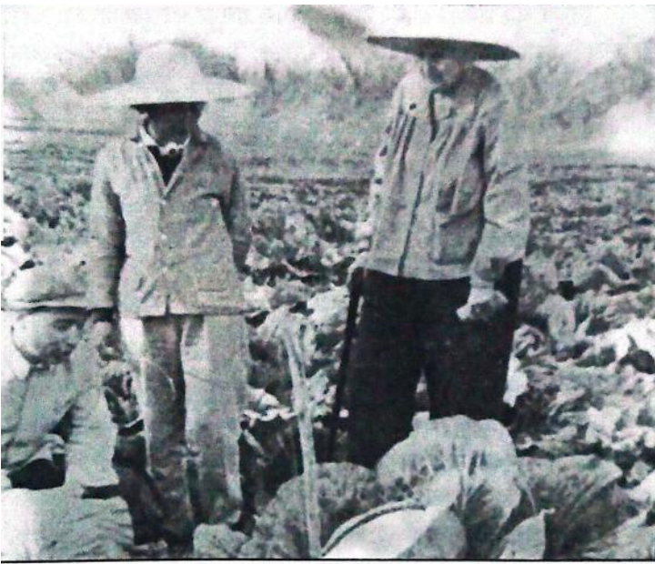
लेखिका अन्ना प्रयोगात्मक खेतीमा ठूला बन्दा बालीको अवलोकन गर्दै

When Serfs Stood Up in Tibet Report by ANNA LOUISE STRONG