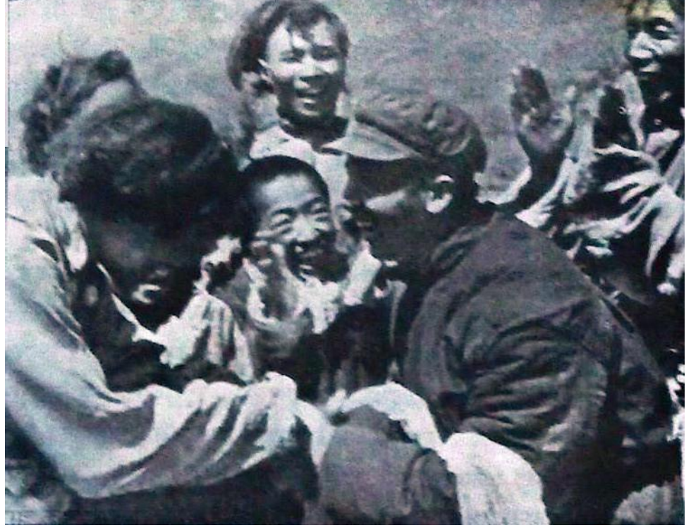
जनमुक्ति सेनाको उपचार टोलीलाई पशुहरू प्रदान गरेकोमा धन्यवाद दिँदै पशुपालकहरू

अक्टोबरसम्ममा उत्तरबाट सुरु भएको बाली भित्र्याउने काम उचाइसम्म पुग्यो। खेतमा बाली काट्दै किसानहरू गीत गाइरहेको समाचार आयो। तिनीहरूले आपसी सहयोग समिति बनाए र एक अर्कालाई खेत जोल पशुहरू आदानप्रदान गर्थे। अन्न भित्र्याइसकेपछि अर्को बाली लगाउन वा बीउ छर्न तिनीहरूले एकैपल्ट खनजोत सुरु गरे। पहिलोपल्ट तिनीहरूले बीउहरू छाने तथा मल सङ्कलन गरे। तिब्बती किसानहरूको लागि परीक्षणबाट उत्पादन पुस्तक निकाल्यो र धेरै वर्षको परीक्षणबाट उत्पादन गरेको ३०६९ प्रकारका अन्नका बीउहरूसँगै ती खेतीसम्बन्धी पुस्तक पनि किसानहरूलाई दिए।