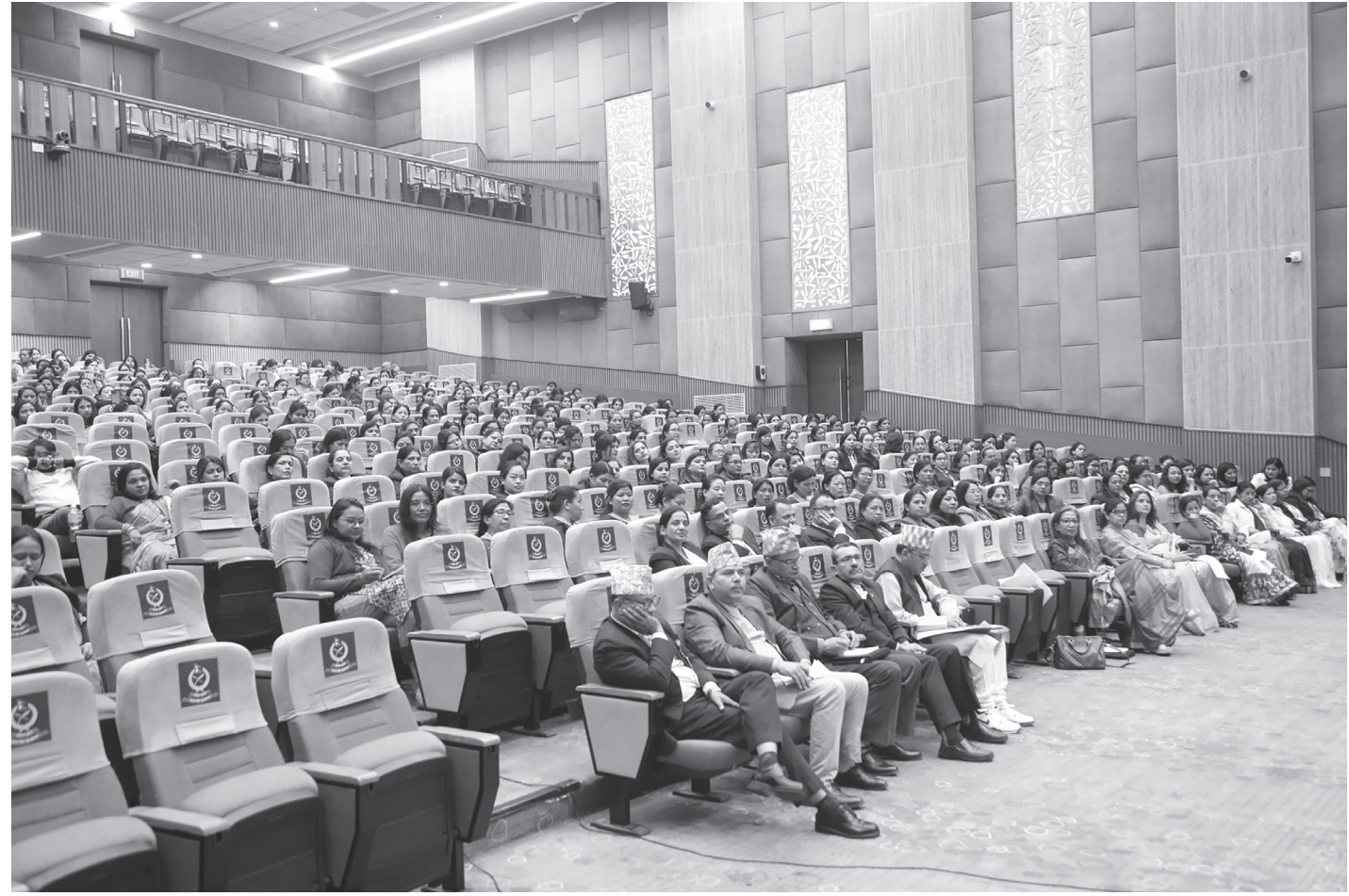
अन्तर्राष्ट्रिय महिला न्यायाधीश दिवस कार्यक्रममा सहभागी

सर्वोच्च अदालतले मङ्गलबार काठमाडौंको प्रदर्शनीमार्गस्थित नेपाल पुलिस क्लवमा अन्तर्राष्ट्रिय महिला दिवस तथा महिला न्यायाधीश दिवसको अवसरमा आयोजित कार्यक्रममा सहभागीहरू।