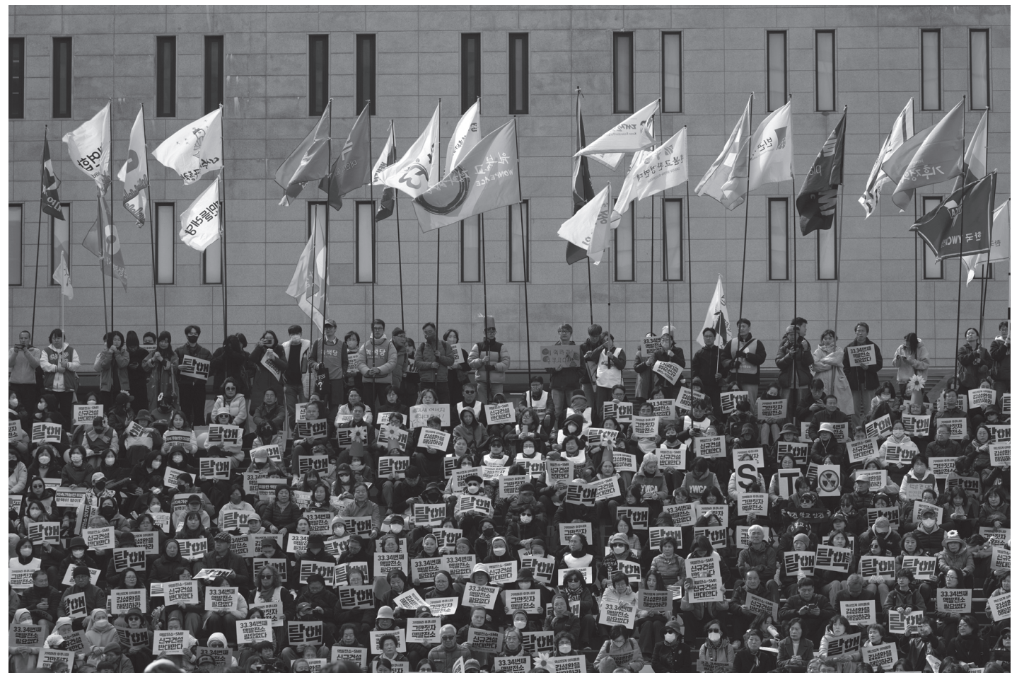
जापानको फुकुशिमा आणविक प्रकोपको १५ औं वार्षिकी पारेर क्षतिपूर्तिको माग गर्दै विरोध प्रदर्शन गरिरहेका दक्षिण कोरियाली जनता मार्च ११, २०२६ का दिन । १५ वर्षअगाडि मार्च ११, २०११ मा महाभूकम्प र सुनामीपछि फुकुशिमा आणविक केन्द्रको भयानक दुर्घटनाको असरले कोरियाली र जापानी जनता पीडित भएका थिए ।