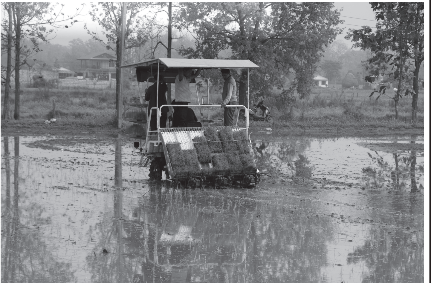
मेसिनबाट चैते धान रोपाईं गर्दै

मौसममा आएको बदलीसँगै नेपालमा पनि प्रदूषणको मात्रा बढिरहेको छ । उपत्यकालागयत सहर क्षेत्रमा बढी प्रभाव देखिएको छ । यो समयमा स्वास्थ्यको विशेष ह्याल गर्न स्वास्थ्य मन्त्रालयले सबैमा अनुरोध पनि गरिसकेको छ । रासस