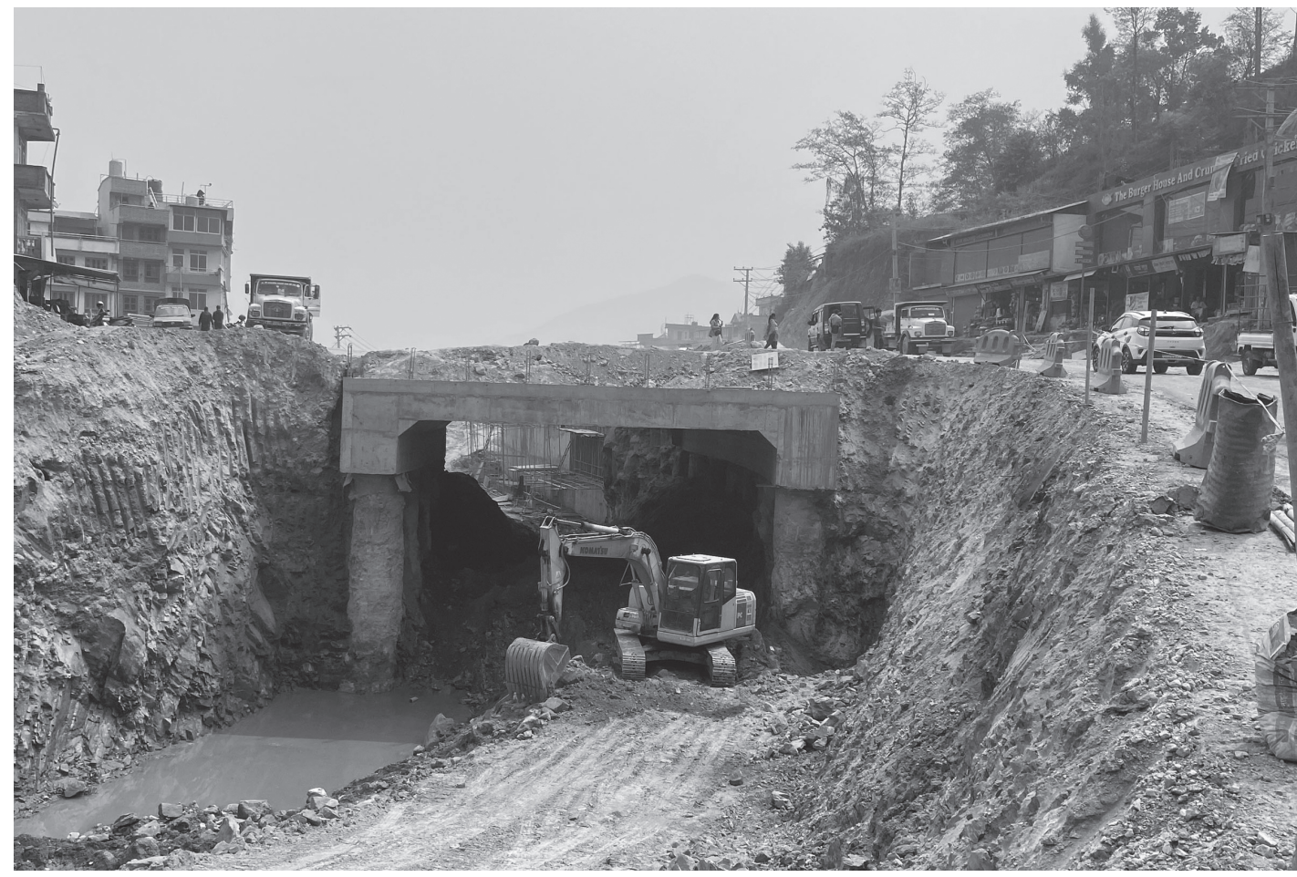
साँगामा 'अन्डरपास' निर्माण गरिँदै

अरनिको राजमार्गअन्तर्गत भक्तपुरको सूर्यविनायकदेखि काभ्रेपलाञ्चोकको धुलिखेलसम्म भइरहेको विस्तार कार्यअन्तर्गत साँगा-धुलिखेल सडक खण्डको दुई जिल्लाको सीमाक्षेत्र साँगामा 'अन्डरपास' निर्माण गरिँदै। सम्झौताअनुसार गत मङ्सिर अन्तिमसाता समयसीमा सकिएपछि पुनः एक वर्ष म्याद थपेर हाल विस्तार कार्यलाई तीव्रता दिइएको सूर्यविनायक-धुलिखेल सडक आयोजनाले जनाएको छ।