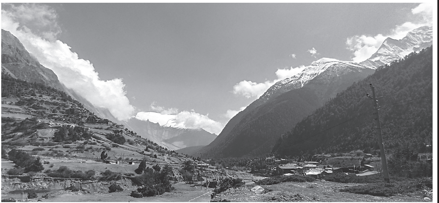
मनाङको पिसाङ गाउँ

यसैबिच, सीमावर्ती इलाका प्रहरी कार्यालय बेलहियाले भारततर्फ लैजाँदै गरेको र भारतबाट नेपालतर्फ ल्याइँदै गरेको गरी केही ग्यास सिलिण्डर नियन्त्रणमा लिएको जनाएको छ । प्रहरीले सीमामा निगरानी बढाइएको र अवैध ओसारपसार रोक्न आवश्यक कदम चालिएको बताएको छ । रासस